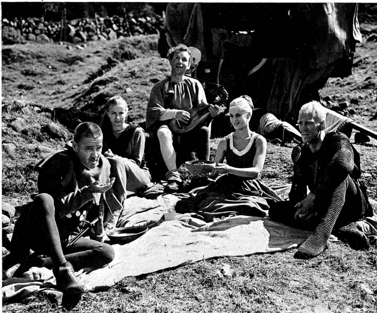
Nur kurze Stunden stillen Glücks sind dem Menschen gestattet, hier dem suchenden Ritter (ganz rechts) und seinem Knappen ( ganz links) bei einfachen Menschen in dem endlich auch bei uns gespielten Film "Das siebente Siegel".

Doch das ist nur eine kurze Szene. Denn sonst lauert hinter allem der Tod. Die Pest rast durch das Land, die Menschen leiden entsetzlich unter dem "schwarzen Tod". Wo bleibt in diesem Totentanz Gott? Die Menschen rufen ihn verzweifelt, veranstalten wilde Prozessionen, peitschen sich, werfen "Hexen" ins Feuer, die angeblich die Seuche mit Hilfe des Teufels gebracht haben. Andere stehlen und mordern, was übrig bleibt, bevor auch sie der Tod schlägt. Und da zwischen durch reitet der Ritter voll bitterer Zweifel und doch wieder hoffend, unfähig, ganz ohne Gott zu leben wie sein Knappe. Er reitet wie Dürers