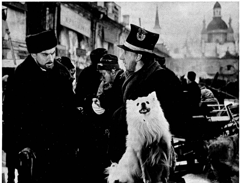
"Die Dame mit dem Hündchen", eine gute, ernste, mit der silbernen Palme in Cannes ausgezeichnete Verfilmung der gleichnamigen Novelle von Tschechow

Das weist auf eine unterschwellig vorhandene Neigung zum Aesthetizismus hin, der in der Sowjetunion keineswegs das Ansehen der Kunstrichter aus der Partei genießt.