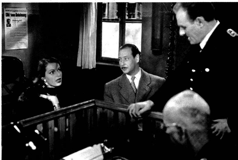
Vom Flüchtlingsschicksal berichtet der unausgeglichenen, aber interessanten Ansätze aufweisende Film "Das Glück kam Sonntagabend"

Offensichtlich ging es ihnen nur darum, nach den "bewährten" Rezepten, mit denen von vielen Produzenten noch immer verzweifelt nach dem immer stärker schwindenden Massenpublikum geangelt wird, einen Kassenerfolg zu sichern. Es ist alles da, was man schon aus tausend Filmen kennt: lächerlich gemimte Kämpfe, hier zwischen rothen Galliern und schwarzlockigen Römern, angeführt von Cäsar und Vercingetorix, der selbstverständlich ein grausiger Bösewicht ist, während Cäsar als besorgter, edelgütiger Soldatenvater erscheint, der sich nach der Schlacht rührend um seine Soldatenkinder kümmert. Ebenso selbstverständlich fehlt die holde Weiblichkeit nicht, die in Cäsars Buch sonst kaum erwähnt wird. Doch hier hat man ihm eine Pflgetochter angefilmt, die eine gewichtige politische Rolle spielt. Dazu kommt der obligate Trupp von Girls, die die Herzen durcheinander bringen müssen, wenn sich diese von dem Opern-Schlachtgetümmel gerade erholen wollen. Und dann der übliche Schuss Brutalität, wozu Folterszenen verwendet werden. Die Kämpfe selber eignen sich nicht zu diesem Zweck, sie sind von zu grosser Komik. Confus und unecht ist dieser Film soweit das Auge blickt, das nicht weiss, ob es ob solcher Kitschmethoden lachen oder ob der Verhuzung des Filmbezugs durch immer wieder neue Machwerke dieser Sorte weinen soll.