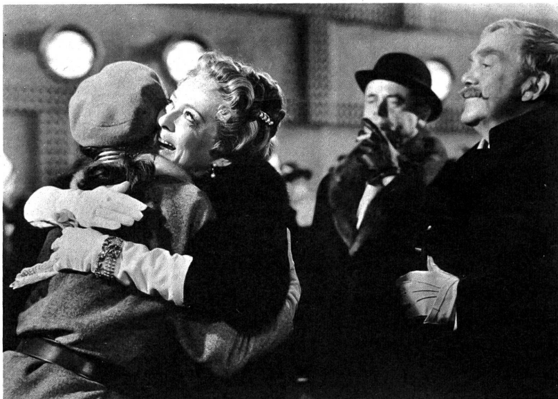
Die arme "Apfel-Annie", als reiche Dame verkleidet, feiert hier Wiedersehen mit ihrer vornehmen Tochter im schönen Capra-Film "Engel mit Pistole"