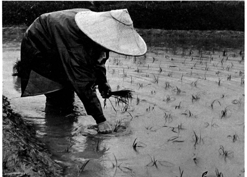
Das Leben muss weitergehen, wenn auch für die Verheerten von Hiroshima nur noch halb. Doch ihren Reis müssen sie haben.

Die Musik zu "Wähle das Leben", die nach den Gesichtspunkten der Montage dramatische oder sinndeutende Effekte setzt, hat Robert Blum geschrieben: eine zeitgenössische Musik, aus der das Erschrecken spricht, aus der die Sehnsucht auch spricht nach der Unbedrohtheit des Daseins. Hans Heinrich Egger hat zusammen mit Erwin Leiser die Montage des schwierig konzipierten Films besorgt. An der Kamera standen der Japaner Hiroshi Segawa, der Franzose Jean-Marc Ripert und der Schweizer Otto Ritter, der jene Sequenzen aufgenommen hat, die die friedliche Verwendung der Atomenergie darstellen (Reaktor Würenlingen, Inselehospital in Bern). Als wissenschaftlicher Berater des ungewöhnlichen Werkes wirkte Dr. Gerhart Wagner, Sektionschef I beim Eidgenössischen Gesundheitsamt, mit.