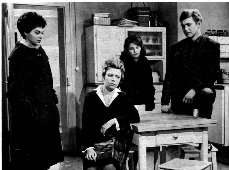
Unterhaltende Ausschnitte aus dem kleinbürgerlichen Familienleben bringt der neue, volkstümliche Schweizer Film "Im Parterre links".