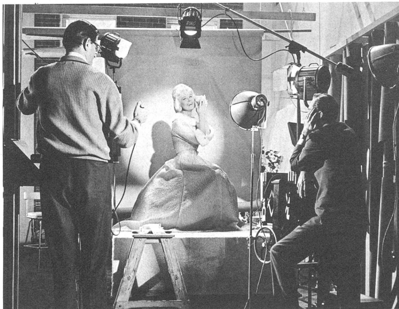
"Was eine Frau so alles treibt" bringt einige Schwächen des Fernsehens ans Licht, mit Doris Day in der Hauptrolle