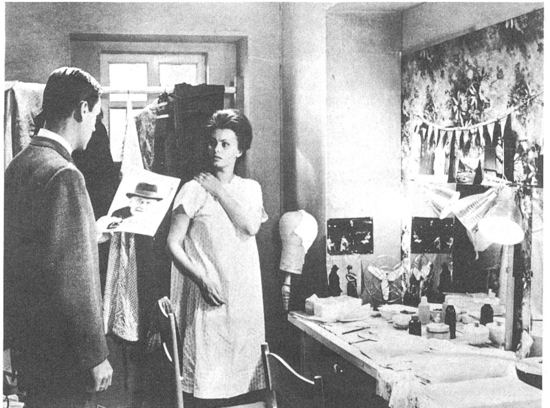
Sofia Loren erweist sich in den "Eingeschlossenen" als subtile Darstellerin

Der zweite Sohn Gerlachs, Werner, und dessen Frau, Johanna, haben nicht schon längere Zeit Wohnsitz im väterlichen Haus genommen, sie treffen eben erst ein, als das Drama Franzens zu seiner Lösung kommt. Und die Türen stehen offen, hinaus auf den Park, der freilich auch noch zur Hölle gehört, denn De Sica lässt ihn von drei scharfen Bluthunden bewachen; hinaus aber auch auf die Werft Gerlachs, auf die