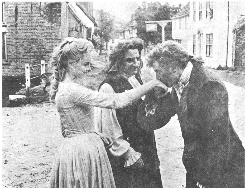
Eine formvollendete, modern-ironische Gestaltung von grossem Kunstverständnis zeichnet "Tom Jones" aus

scharfen Lektionen einsteckt, die er erhält, als wären sie ein Teil des Vergnügens.