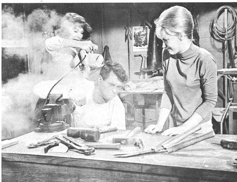
Im "Goldfisch an der Leine", einem sommerlichen Unterhaltungsfilm, geht es manchmal turbulent zu

Nr. 1124 Die Schweiz - Land der Schulen (farbige Sonderausgabe mit einem Querschnitt durch unser Schulwesen, von der Volksschule bis zur Universität, im ersten Teil moderne Schulbauten, im zweiten Einblicke in fortschrittliche Schulbetriebe).