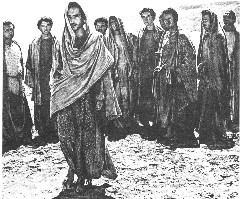
Christus, mit dauernd strenger Miene, nazarenisch, im Kreise von Jüngern, wie es sich der Marxist Pasolini im Film "Evangelium nach St. Matthäus" vorstellt

Damit ist offenkundig, dass Pasolini kein Christ ist und keine Ahnung vom wirklichen Christus besitzt. Sein "Christus" soll sich nur horizontal, in der Breite, auf dieser Erde auswirken. Das vertikale Verhältnis Mensch - Gott ist ihm gleichgültig. Zwar stehen unmotiviert daneben auch Wunder, die Christus verrichtet, besonders ausführlich sein Wandeln auf den Wellen. Doch ist das keine Einfügung der religiösen Botschaft, die Christus gebracht hat, sondern erfolgte deutlich im Geiste des italienischen Vulgär - Katholizismus, dem Pasolini selber entstammt, und der auf diese Dinge grosses Gewicht legt. Aber die neue Botschaft von Gott, die Christus gebracht hat, diese ganz zentrale, religiöse Motivierung seines Tuns, kommt überhaupt nicht zur Darstellung. Pasolini weiss von diesem Kernpunkt überhaupt nichts, interessiert sich wahrscheinlich auch nicht dafür.