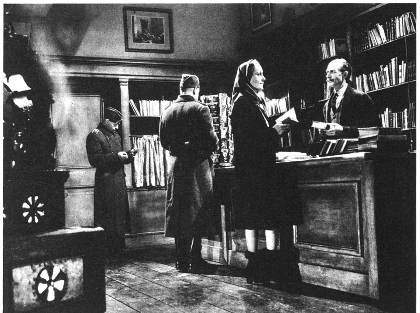
Eine bemerkenswerte Reprise ist der Film "Sein oder Nicht-Sein", der die Nazis 1942 witzig lächerlich macht, als ihre grauenhaften Untaten noch unbekannt waren.

Nun, Otto Premingers "In Harm's Way" ist deshalb ein erfreulicher Film, weil er ohne Hemmung nach dem Rezept gemacht ist, das Erfolg verspricht: als Mischung von Kampfszenen mit Szenen privaten Lebens, vor allem traulicher und zuweilen auch untraulicher Familienereignisse und frischfröhlicher oder moralisch zweifelhafter Beziehungen zum weiblichen Geschlecht. "In Harm's Way" ist ein Film, der mit Pathos operiert, den Krieg zwar nicht gerade verherrlicht, ihn aber