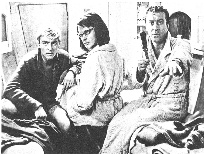
Das Dreieck im "Messer im Wasser", einem ausgezeichneten, kritischen, polnischen Film

Urteilt man bloss nach der "Handlung", die uns "Das Messer im Wasser" vor Augen führt, so wird man der Aussergewöhnlichkeit dieses Films nicht richtig inne werden. Sein Besonderes realisiert sich erst in der Form, durch welche die Handlung aus ihrer Banalität herausgehoben wird. Worum geht es? Ein Sonntagsausflug im Sommer: Ein Ehepaar mittleren Alters, der Mann von Beruf Redaktor, privilegiert wie jeder, der in der "Neuen Klasse" angelangt ist, verbringt den freien