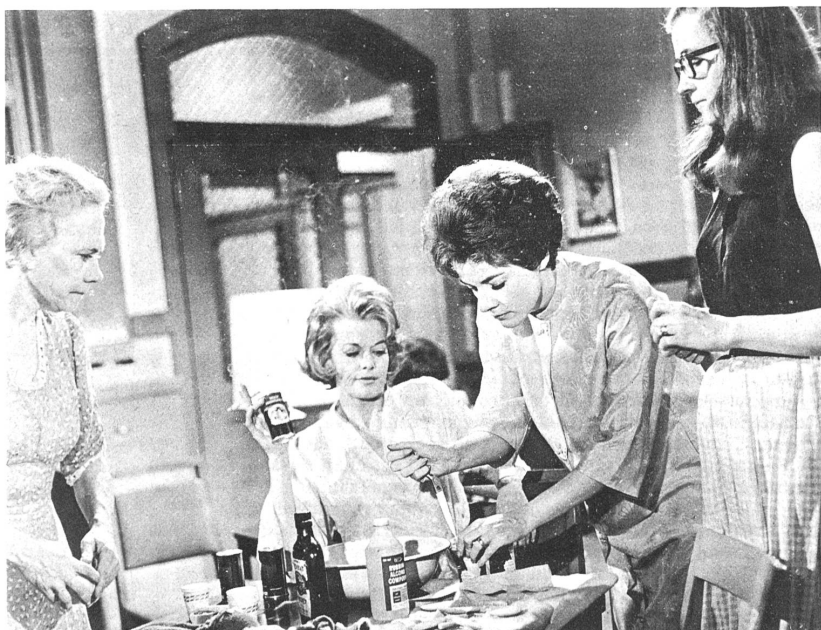
In der Anstalt begeben sich im Film "Ein Arzt setzt sich durch" vier kranke Frauen auf verbotene Pfade