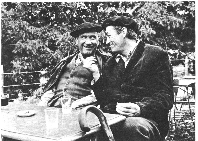
Gregory Peck (rechts), rot-spanischer Flüchtling, nimmt vor dem letzten Kampf von seinem Freund (Paolo Stoppa) Abschied im Film "Deine Zeit ist um".

Doch ist das nur eine Deutung, die noch dadurch unsicher wird, dass Zinnemann das realistische Geschehen mit einem Tiefsinn zu untermauern versuchte, der offenbar eine gewisse mystisch-endezeitliche Stimmung erzielen sollte, mehr, als gewisse Zusammenhänge zu erklären. Auch bei andern, künstlerischen Werken lässt sich neustens in Amerika der Hang zu einer solchen apokalyptischen Stimmung feststellen, der offenbar aus der schwierigen politischen Weltlage, die zunehmend pessimistisch beurteilt wird, stammt. Der Bezug auf die bekannte Stelle in der Offenbarung über das "fahle Pferd des Todes", der im englischen Originaltitel zum Ausdruck kommt, wirkt jedoch äusserlich aufgeklebt und ist durch das Geschehen nicht begründet. Auch der Wille zu einer