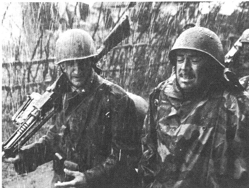
Die beiden Italiener in Russland, die ihre Menschlichkeit bewahren, im Film "Im Höllenkessel der Verdammten".

Bemerkenswert ist dagegen, wie er eine andere Schwierigkeit bezwungen hat: die uns doch noch immer fehlende Distanz zur Beurteilung des Kriegsgeschehens. Abgesehen von der politischen Bindung vermag er das Geschehen mit grosser Objektivität zu beurteilen. Gewiss sind die Wunden des Krieges bei den kriegführenden Völkern noch lange nicht geschlossen, aber wenn sich ein Mann von Können und Begabung damit befasst, ist die Berührung heilsam.