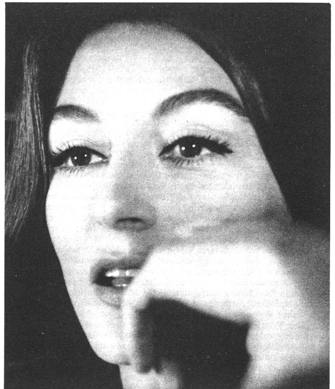
Anouk Aimée in der Hauptrolle des Films "Ein Mann, eine Frau", der in Cannes den Grossen Preis erhielt

Wem kann eine solche Geschichtsklitterung schon nützen? Niemandem. Sie erzeugt nur Misstrauen und schädigt den Ruf ihrer Urheber. - Niemandem zu empfehlen.