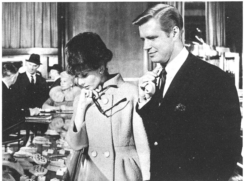
Audrey Hepburn in einer andern Haltung im Film "Frühstück bei Tiffany", (Besprechung 1962, Nr. 5)

ZS. Auch der anspruchsloseste Freund leichter Musik wird mit diesem wässrigen Schlagerfilm nichts anfangen können. Die Geschichte ist so abgestanden und clichéhaft, die Pärchen kommen mit so langweiliger, automatischer Sicherheit nach den gewohnten Verwechslungen zusammen, man hat sich so wenig Mühe um etwas Originalität gegeben, dass an diesem Farb-Film mit der grössten Anstrengung nichts zu rühmen bleibt. Auch wenn die Erzählung nur dazu dient, um Schlager daran aufzuhängen, sollte sie nicht derart flüchtig behandelt werden. Dazu sind allerdings auch die Schlager schwach, sie stehen sogar grösstenteils mit der Handlung in keinem Zusammenhang. Eine Ausnahme macht nur "Mit 17 hat man noch Träume", aber der ist inzwischen sowieso bekannt geworden. Die Gags sind so uralte, dass sie versteinern statt erheitern wirken. Der Titel ist das einzig Uebermütige.