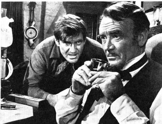
Der Abenteurer Chuka versucht vergeblich, im guten Wild-Wester gleichen Namens den Obersten zur Aufgabe des unhaltbar gewordenen Forts zu veranlassen.

Der Film ist routiniert gedreht und geschnitten worden, mit einem offenen Blick für menschliche Eigenheiten. Dass der Held Chuka am Ende mit einer Frau allein übrig bleibt, dass auch eine allzu süsse Liebesgeschichte, für die Douglas nie Talent bewies, hineinverwoben ist, vermag dem im allgemeinen positiven Eindruck des Films keinen Abbruch zu tun.