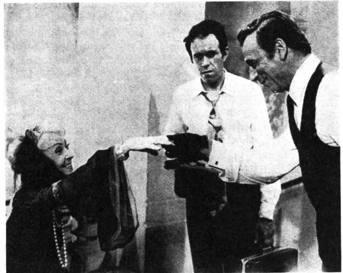
Madeleine Renaud und Yves Montand (rechts), die beiden charmant-raffinierten Gegenspieler in «Le Diable par la queue»

Das ist natürlich alles nur unterhaltend und nicht etwa gesellschaftskritisch gemeint, wenn auch ein Anflug von hinterhältiger Satire dabei ist. Doch ist der Film bei aller effektsuchender Spritzigkeit, von solcher gallischer Beschwingtheit, von einem so schwarzglitzernden Charme, dass er stellenweise beinahe poetisch wirkt und an Grössen der modernen, französischen Literatur erinnert. Die grossartig überlegene Art, in der Madeleine Renaud die raffinierte Grossmutter spielt, blitzartig-spontan, passt hervorragend in die impressionistische Leichtigkeit der Gestaltung. Sie überragt auch die wieder chargierende Maria Schell bei weitem.