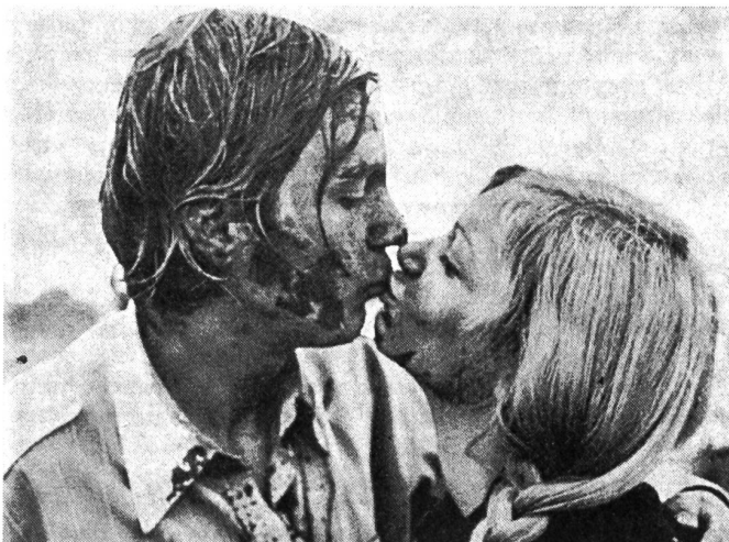
Das Revolutionsmädchen, das scheitert, mit einem seiner Kumpanen im bedeutsamen jugoslawischen Film «Frühe Werke».

uj. «Rani Radovi» ist ein Film über die Unmöglichkeit, die Revolution mit traditionellen Mitteln heute zu einem erfolgreichen Abschluss zu bringen. Das muss auch das bildhübsche Mädchen Jugoslava erfahren, das — zusammen mit drei Burschen und einem Deux-Chevaux — ausgezogen ist, den Leuten die Revolution zu bringen. Nachdem es erfahren muss, dass das Volk gar kein «besseres Leben» will, beschliesst es, wenigstens mit dem Volk zu leiden. Doch seine drei Kumpanen sind des Mitleidens bald überdrüssig und übergiessen die schöne Jugoslava — Urheberin des so viel Qualen bringenden Gedankengutes — mit Benzin und lassen sie in einer qualvollen Wolke gen Himmel aufsteigen.