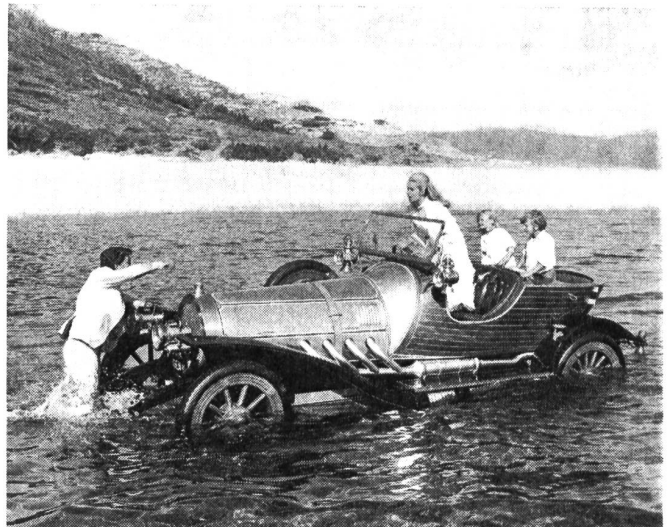
Von der Flut wird hier das Zauberauto Tschitti-Tschitti in dem gleichnamigen Musical überrascht, das neben guter Musik und Regie auch eine Parodie auf James Bond enthält.

So wird anscheinend nur die öffentliche Verbreitung von rassenhetzerischen Büchern und Schriften verfolgt, was die Gründung von privaten Klubs bewirkte, in denen diese Literatur für jedes Mitglied bei geringem Eintrittsgeld frei zirkulieren kann. Sonderbarer ist jedoch, dass selbst Wissenschaftler immer wieder auftreten, um die Minderwertigkeit aller andern Rassen gegenüber der kaukasischen darzulegen.