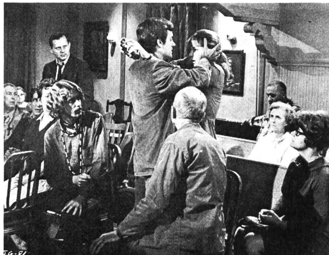
Die mit Komplexen beladene Lehrerin (Joan Woodward) wird sich in einer religiösen Versammlung plötzlich der Ursache ihrer Aengste bewusst («Die Liebe eines Sommers»)

FH. Es ist wieder das Los der unverheirateten Frau, das Gegenstand des Themas bildet, diesmal — nicht zum erstenmal — wieder in Gestalt einer Lehrerin. Sie befindet