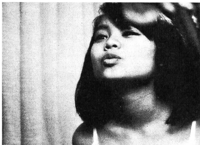
«Das Mädchen Nanami» ist die tragisch endende Liebesgeschichte eines aufopferungsfähigen, klugen Mädchens aus Japan.

Die Geschichte ist beinahe simpel: Shun, ein junger Goldschmied, verliebt sich in das Aktmodell Nanami. Der Verbundenheit des Paares stehen zwei Jugenderlebnisse Shuns entgegen, die ihn zutiefst erschüttert haben. Als er sechsjährig war, versuchte sein Pflegevater, sich an ihm zu vergreifen, Jahre später wurde er verprügelt, als Beobachter seine Freundschaft zu einem kleinen Mädchen falsch deuteten. Mit grosser Sorgfalt und sichtbarem Einfühlungsvermögen hilft Nanami dem Jungen, seine Komplexe zu überwinden. Damit gibt sie ihrem Leben selber einen Inhalt, der ihrer Weiblichkeit und Mütterlichkeit entspricht. Im Augenblick, in dem das Glück der beiden Liebenden greifbar wird, läuft Shun unter ein Auto. Der Unfall