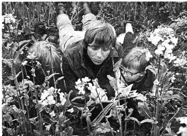
In Monte Carlo gesehen: Vater erzählt den Kindern mit Bilderbuch, wie Gott die Tiere, Blumen und Gräser schuf. (Jugendsendung im Ikor-Fernsehen des ökumenischen Kirchenrates in Holland, Produktion Wim Koole)

Die Engländer (BBC) brachten eine sehr differenzierte Reportage in Farben über das Leben des stigmatisierten Padre Pio aus einem italienischen Kloster. So etwas an Dokumentation habe ich noch selten zu Gesicht bekommen. Die Sendung hielt einen bis zuletzt in Atem. Menschen wurden interviewt, die von ihren Heilungen berichteten, ein bekannter Psychiater über das Phänomen der Stigmatisation befragt und Padre Pio kurz vor seinem Tod beim Zelebrieren der Messe gezeigt. Die Kameraführung war diskret, auch wo sie den Toten im Gewühl der Volksmenge zeigte. Ein Stück katholischer Volksfrömmigkeit wurde hier authentisch aufgezeichnet und dazu untermischt mit klugen sozialkritischen Fragen nach dem Schicksal der Bauern in jenem Dorfe. Das alles war ausgewogen in Frage und Antwort, jedoch wurden am Schluss durch den Vorschlag zur Heiligsprechung die Grenzen leicht überschritten. Immerhin bedenke man, dass dies eine BBC-Produktion für ein mehrheitlich nichtkatholisches Land war. Der Film erhielt den Dokumentarfilmpreis, obwohl gerade katholische Kritiker aus Deutschland ihn mit scharfen Worten angegriffen hatten.