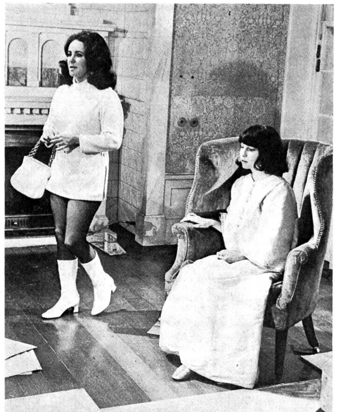
Elisabeth Taylor (links) in Loseys Film «Die Frau aus dem Nichts», vermag den Film nicht auf eine allgemeingültige Ebene zu heben.

Von diesem Ende her, dessen «darwinistische» Moral doch allzu plump ist, entpuppt sich der Film, was schon vorher immer wieder zu vermuten war, als Untiefe. Losey hat hier nicht mehr zustande gebracht als eine psychologische Schauerwär. Natürlich fasziniert seine Begabung, zwielichtige Naturen, frustrierte und gebrochene Menschen, glaubhaft zu machen; natürlich hat er Meisterschaft zur Hand, indem er alle Spannung daraus gewinnt, dass er die Beziehungen zwischen den Personen undurchsichtig hält. Aber allzu oft gleitet die Spannung ins Melodrama ab, allzu oft bleibt der Film in der plakativen Romantik der Schaueratmosphäre stecken. Und unerträglich wird Losey dann, wenn er sein formale Ticks zelebriert, seine Symbole, die meist leer sind, etwa die Spiegelwände, in deren Widerbildern sich das Mädchen narzistisch dreht, die mechanischen Puppen und die Spieluhren, die erklären sollten, was mit