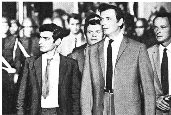
Ein politischer Mord, von hochgestellter Seite veranlasst und gedeckt, ist Gegenstand des wichtigen Films «Z» von Costa Gavras

Der Name Gregories Lambrakis wird nie ausgesprochen, die Bezeichnung Griechenland fällt nicht. Und doch ist jedem klar: Costa-Gavras meint mit seinem Film «Z» den Mord an diesem Abgeordneten der pazifistisch gesinnten Union der Linksdemokraten (EDA), die Untersuchung gegen die Verantwortlichen und den Prozess, der zur Farce wurde. Gemässigte und Linke spenden dem Werk gemeinsam Beifall: einer der es sagen darf. Costa-Gavras als Enthüller der schmierigen Geschäfte und perfiden Schachzüge hoher griechischer Militärs, die heute zum grossen Teil wieder an der Macht sind. Gewiss, das stimmt. «Z» ist indessen weit mehr als die exakte Rekonstruktion eines politischen Verbrechens. Der Film ist ein Modellfall für die Diktaturen schlechthin, für jene in Griechenland so gut wie für jene in Spanien oder in verschiedenen südamerikanischen Staaten, für westliche und östliche. Starke Männer in Uniform und kriecherische Minister sind nicht allein in Hellas eine Gefahr. Und letztlich: das Gespenst der Diktatur, mag sie durch einen Tyrannen, Militärs, ein Scheinparlament oder eine Einheitspartei ausgeübt werden, lauert hinter jeder Demokratie. Besonders wenn sich diese nicht mehr auf ihre inneren Werte besinnen sollte: die Rechte