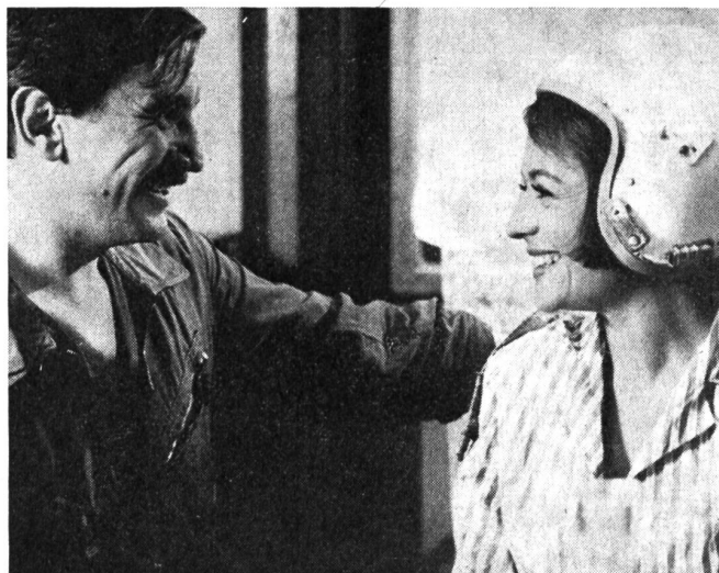
Die wankelmütige Lehrerin (Annie Girardot), die im Film «Es regnet in meinem Dorfe» viel Unheil anrichtet.