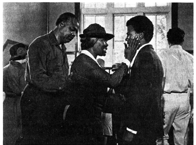
In dem in Edinburgh gelaufenen Film «Der Baum der Erkenntnis» versuchen Eltern, dem Sohn Selbstachtung, Liebe und Fairness beizubringen. Er hat aber noch manch anderes zu lernen.