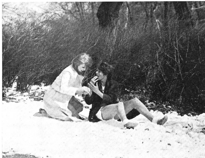
In dem deutschen Beitrag am Filmfestival von Venedig «Deep end» wird die tragische Liebesgeschichte eines Fünfzehnjährigen zu einem aufreizenden, jungen Mädchen erzählt, die in einer mörderischen Rebellion des Jungen endet.

«Strategie der Spinne» hiess der bedeutendste italienische Beitrag von dem begabten Bernardo Bertolucci. Ein Sohn sucht den Tod seines als Widerstandshelden verehrten Vaters zu erhellern, muss aber schliesslich erfahren, dass dieser ein Feigling war, jedoch zum Helden gemacht wurde, um dem Widerstand einen Märtyrer zu geben. Von grosser bildlicher Ausdruckskraft, in den Farben kaum übertroffen, ist der Film doch als linksradikale Herabwürdigung des Widerstands und des Andenkens an ihn empfunden worden. Die äusserste Linke trifft sich hier wie so oft in der Geschichte mit der äussersten Rechten, welche die Anti-Faschisten ja ebenfalls verfolgt. — Glauber Rocha aus dem brasilianischen Untergrund-Kino konzipierter Film «Der Löwe hat sieben Köpfe» erwies sich als emo-