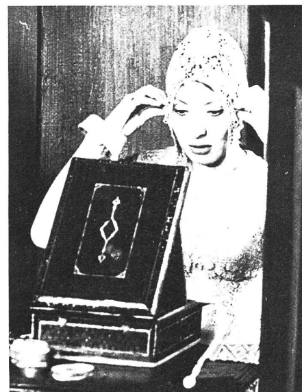
Historischer Film auf ironisch-kühler Ebene: «Blanche» von Walerian Borowczyk

Wesentlich verschlüsselter gibt sich der Film «Sao Bernardo» des Brasilianers Leon Hirszman. Da wird die Geschichte eines Mannes ausgebreitet, der in ehrgeiziger Weise Besitz erwirbt, unersättlich wird und damit verkümmert. Die Frau, die er wählt, die aber eine andere Lebensvorstellung mit in die Ehe bringt, wird er erst nach deren Tod – in Erkenntnis der unglückseligen Situation – lieben können. Die scheinbar einfache und unkomplizierte Story – sie ist dem gleichnamigen Roman von Graciliano Ramos nachgestaltet – ist durchaus politisch zu verstehen und regt zu Überlegungen über die politische Situation Brasiliens an. Zu den interessanten Filmen des lateinamerikanischen Kinos gehört zweifellos auch Manuel Octavio Gomez' «Los dias del agua», in dem über die Wundertaten, aber auch das politische Versagen einer von Gott und Maria inspirierten «Heiligen» in Kuba berichtet wird.