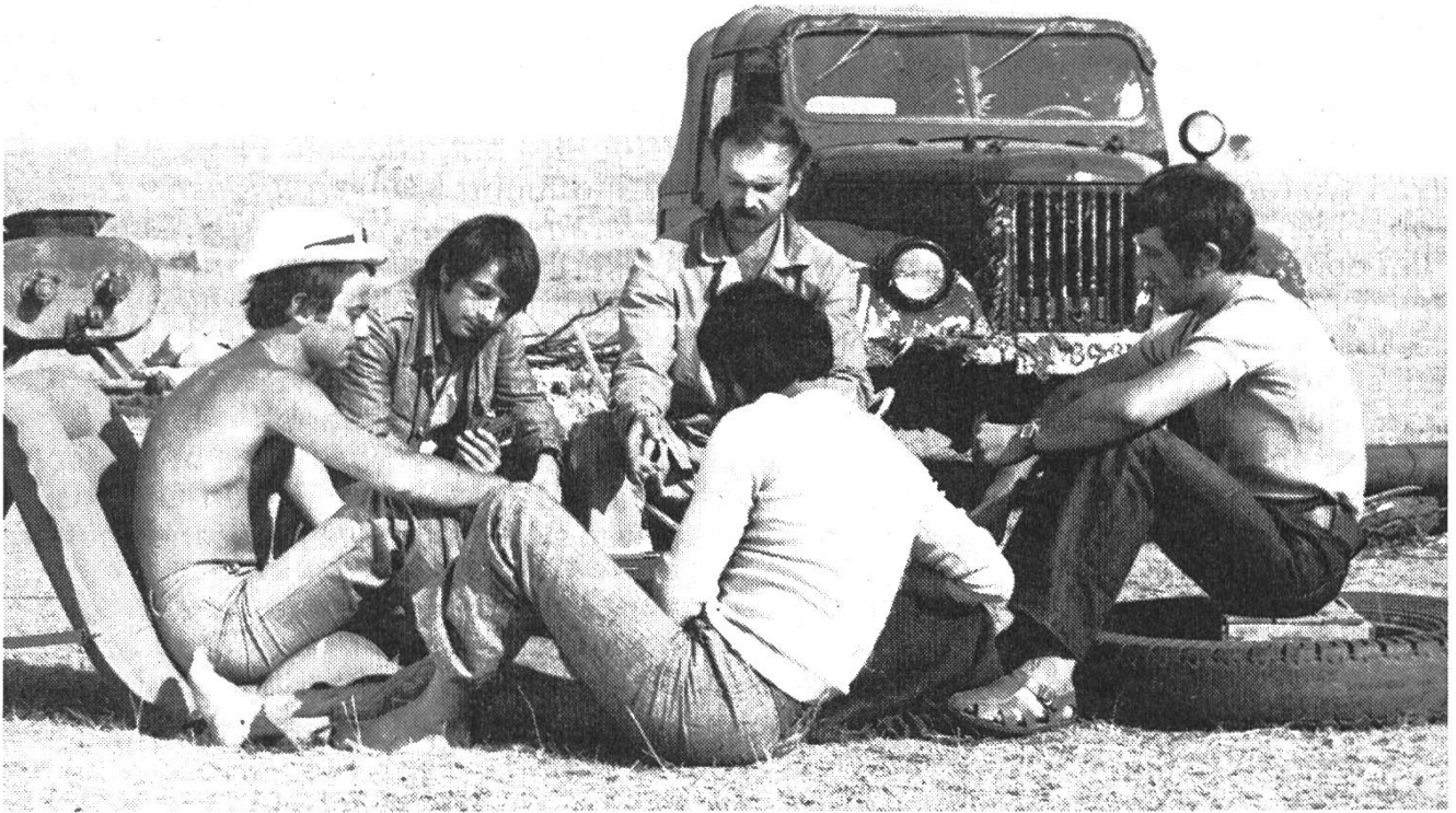
«Starke Wasser» von Iwan Terziev

dem Film zuwandte. Zusammen mit dem Trickfilm-Regisseur Todor Dinov machte er «Die Altarwand» (1969); dann drehte er den Dimitrov-Film «Hammer und Amboss» (1971); doch sein künstlerisches Gesicht, seinen Stil fand er erst in seinen letzten Filmen.