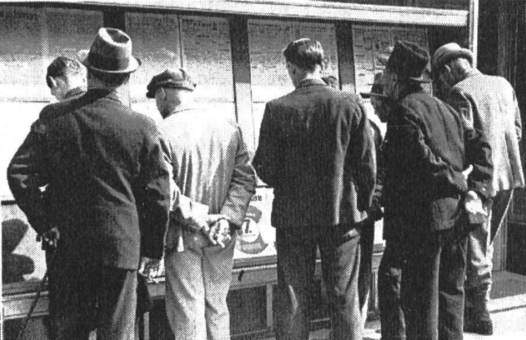
«Die Früchte der Arbeit»: filmische Chronik der schweizerischen Arbeiterbewegung.