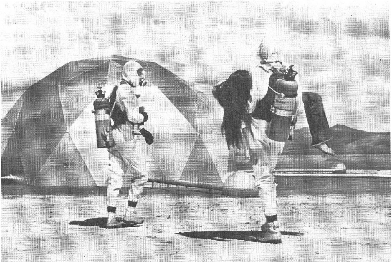
Aus «Phase IV» von Saul Bass (Grossbritannien 1973).

Skepsis gegenüber der Machbarkeit aller Dinge und einer unüberschaubar werdenden Dimension der Technik sowie die Sehnsucht nach dem Mysterium, die sich mitunter auch ganz einfach als Verlangen nach Romantik in einer durchrationalisierten, rein funktionalen Welt äussert, prägten das Genre nicht immer. Science-Fiction, die in ihrer heutigen Form auf Jules Verne zurückgeht, ist eng mit der Entwicklung der Technik und dem Glauben an die Veränderbarkeit der Welt durch sie verbunden. «Alles, was ein Mensch ausdenken kann, wird ein anderer Mensch realisieren können.» Diese Devise Vernes hat seine phantastischen Romane geprägt. Sie sind von jener unerschütterlichen Fortschrittsgläubigkeit getragen, die aus der Philosophie der Aufklärung genährt wurde. Nach ihr hat der Mensch die Möglichkeit, seine Umgebung, ja auch sein Schicksal zu gestalten, wenn immer er nur will. Dass diese bedingungslose Fortschrittsgläubigkeit einem Missbehagen, zumindest aber einer kritischen Distanz gewichen ist, hat zwei Ursachen: Die Erfahrung im Um-