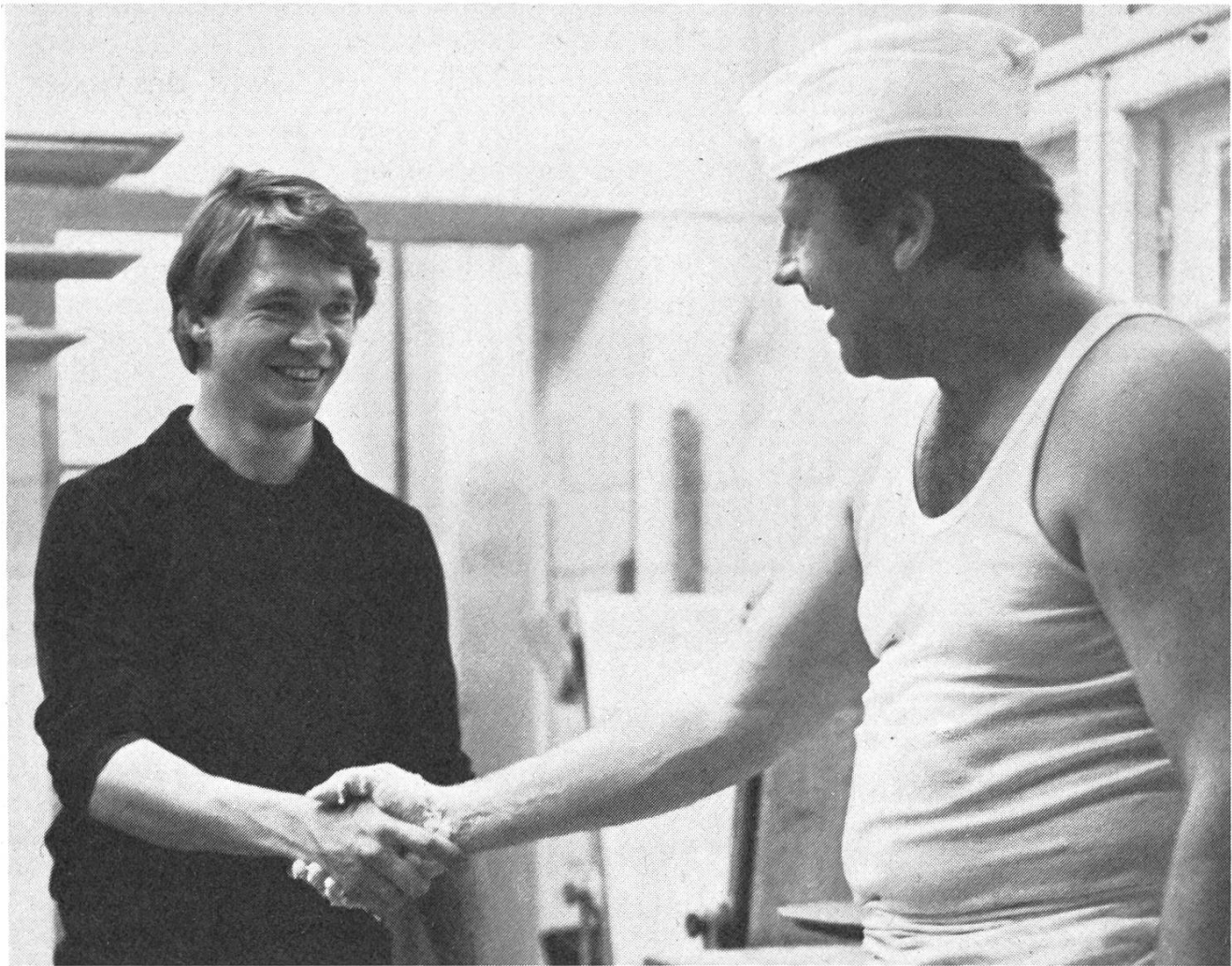
Emigration als letzter Ausweg: der talentierte Schweizer Regisseur Erwin Keusch hat seinen Spielfilm «Das Brot des Bäckers» in der Bundesrepublik gedreht.

ger Jahre, als beschlossen wurde, eine Filmgesetzgebung auf die Beine zu stellen. Jetzt haben wir diese Filmgesetzgebung. Sie würde an sich durchaus funktionieren, sofern die erforderlichen Mittel vorhanden wären. Meiner Meinung nach hat sich die unmittelbare Sorge auf die finanziellen Aspekte zu beschränken.»