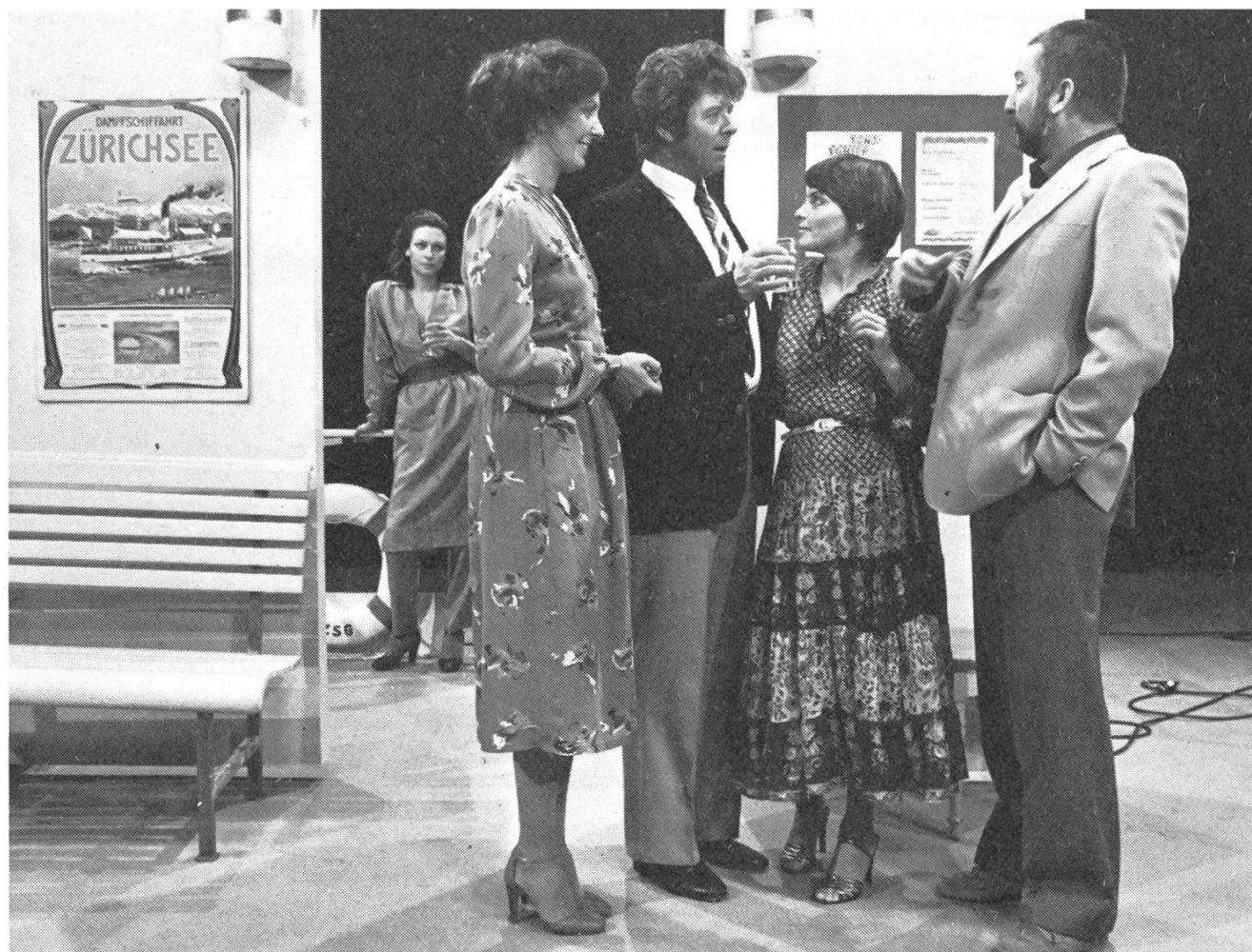
Kein Ort für Bekenntnisse: «Telearena» vom 7. November.

Im Gegensatz zum «Wer bin ich?» ist die Telearena ihrer ursprünglichen Konzeption nach (vgl. ZOOM-FB 17/79) ein Sendegefäß mit einem themenkonzentrierten Schwerpunkt. Bei früheren «Telearena»-Sendungen, zum Beispiel über Atomkraftwerke oder über die Homosexualität, standen lebendige, thematische Auseinandersetzungen im Mittelpunkt. Bei der Diskussion prallten Interessen und Meinungen aufeinander. In einer Art Bürgerdebatte wurde mit Argumenten und Polemiken gestritten. Es ging um Probleme unserer Zeit, um Probleme mit einer ausgesprochen