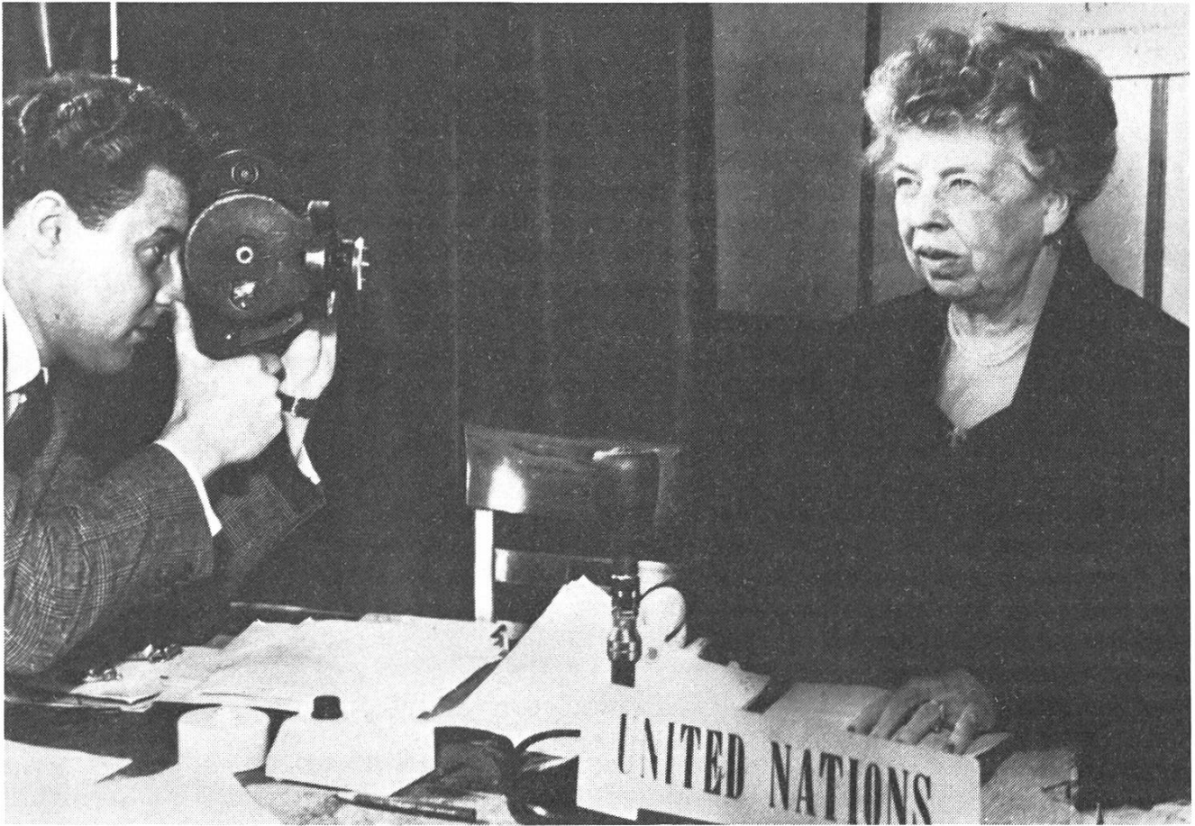
Eleanor Roosevelt wird 1945 in Genf gefilmt.

Stattdessen ist das «Cinéjournal au féminin» eine engagierte, filmische Auseinandersetzung über das Bild der Frau in der Schweizerischen Filmwochenschau. Bei dieser hermeneutischen erklärenden, auslegenden Untersuchung sollte deshalb der subjektive Standpunkt der Untersuchenden nicht ausgeschaltet, neutralisiert werden. In der Auseinandersetzung mit dem Objekt bildete sich dieser vielmehr erst heraus, er profilierte sich. Für den Betrachter hat die subjektive Interpretation jeweils soviel Evidenz, als das Niveau der Auseinandersetzung das gezeigte Material zu verarbeiten, zu integrieren vermochte. Zur Diskussion stehen deshalb bei einer hermeneutischen Analyse immer zwei Sachen: der Standpunkt der Untersuchenden und das zu untersuchende Material. (Im übrigen soll noch vor dem Filmfestival in Locarno eine Nummer der Filmzeitschrift «Travelling» erscheinen, die diesem Film gewidmet sein wird. Darin werden unter anderem die Autorinnen über die Untersuchungsmethode Auskunft geben. Es werden darin die Texte der im Film verwendeten Ausschnitte der Filmwochenschauen und deren Archivnummern veröffentlicht.)