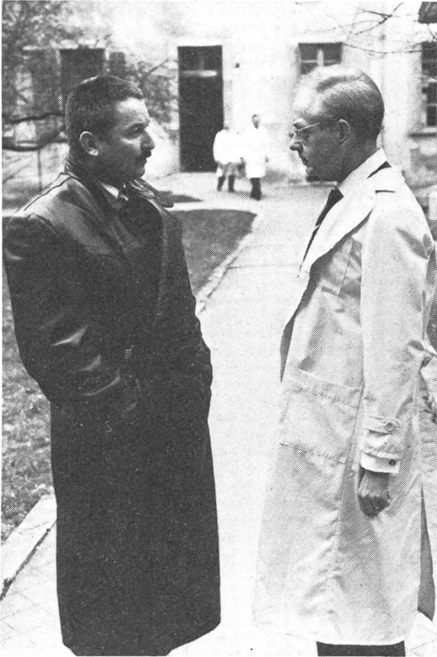
Wachtmeister Studer: hartnäckig in seinen Fahndungsmethoden.