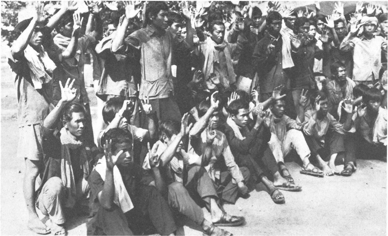
Erschütterndes Dokument über Kambodscha: «Kampuchea: Sterben und Auferstehen» von Heynowski und Scheumann (DDR).

aufzufassen, bleibt allerdings nur scheinbar dem Betrachter überlassen; der Film ergreift eindeutig genug Partei.