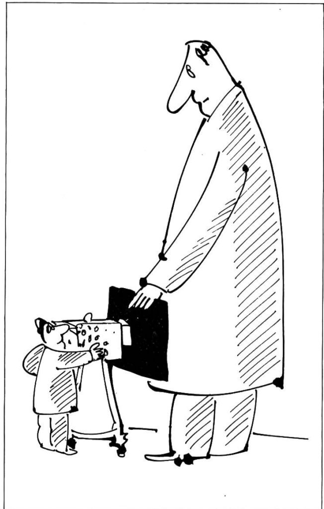
Karikaturen: Erich Gruber.

Das Beschwerdewesen schafft einen Ausgleich und eine Verbindung zwischen dem Publikum und den Programmschaffenden. Dabei geht es nicht darum, einer Person zu ihrem subjektiven Recht zu verhelfen (Urheberrecht, zivilrechtlichen Persönlichkeitsschutz). Dafür bleiben die ordentlichen Gerichte zuständig. Mit der Programmbeschwerde kann die Verletzung von Bestimmungen des Radio- und Fernsehgesetzes und der Konzession gerügt werden. Um Zensur auszuschließen, kann grundsätzlich nur gegen bereits verbreitete Sendungen Klage geführt