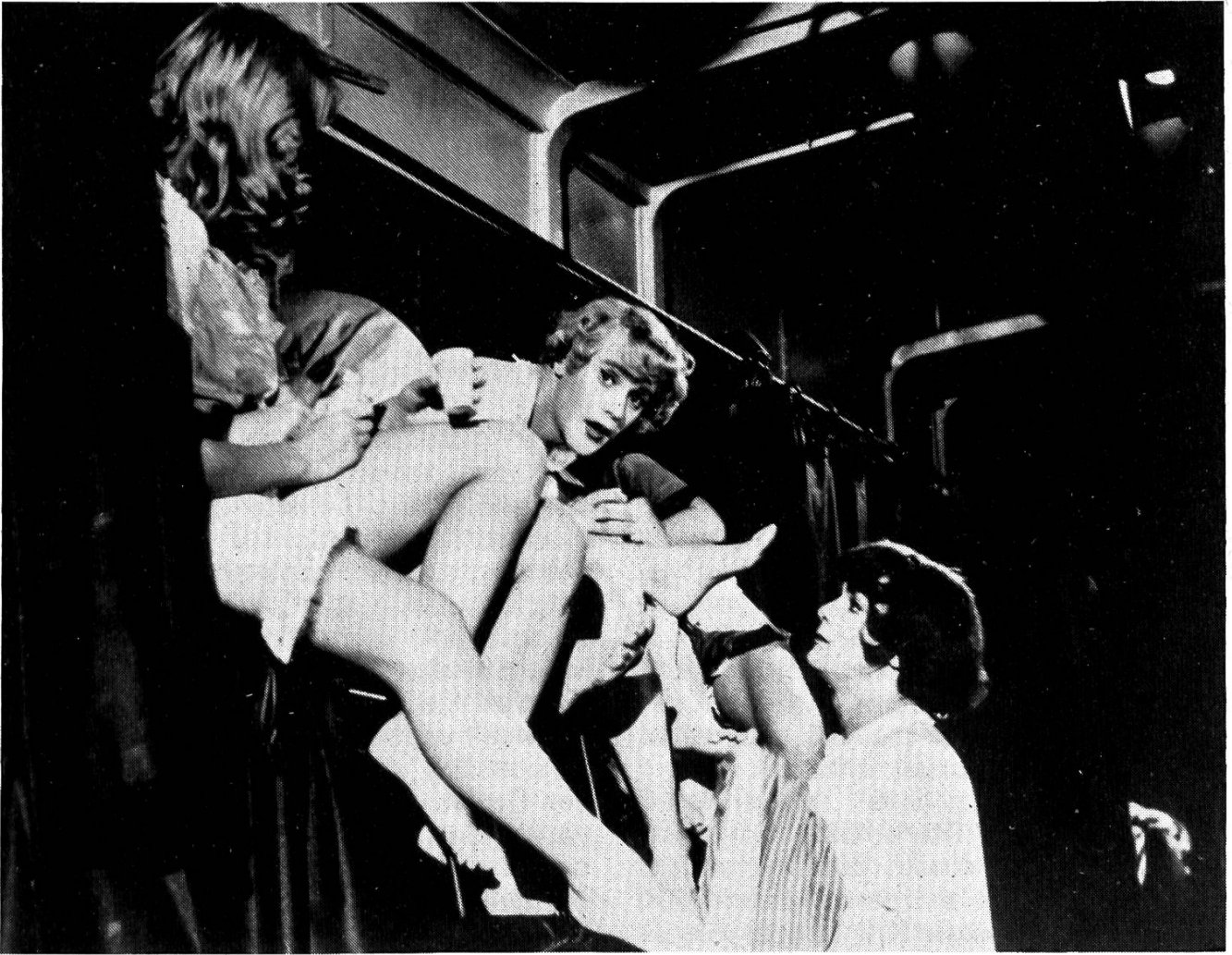
Jack Lemmon und Tony Curtis als Mitglieder des Damenorchesters im Schlafwagen.

fene Meer hinaus und Daphne versucht ihrem Zukünftigen zu erklären, warum er ihn nicht heiraten kann. Dass er raucht, macht nichts, Kinder können adoptiert werden, und als Jerry sich die Perücke vom Kopf reisst und verzweifelt meint: «Du verstehst nicht, ich bin ein Mann», antwortet sein Verehrer: «Nun ja, niemand ist vollkommen.» «Bereits sehr früh während der Arbeit am dramaturgischen Gerüst von «Some Like It Hot», sagte mein Freund Diamond ganz richtig: «Wir müssen einen Kniff finden, einen eisernen Griff, der die Jungs in den Frauenkleidern festhält und sie daran hindert, einfach zu sagen: Schaut her, ich bin ein Kerl. – Es muss eine Sache auf Leben und Tod sein!», berichtet Wilder, und es ist in der Tat diese starke Struktur, die den Zu-