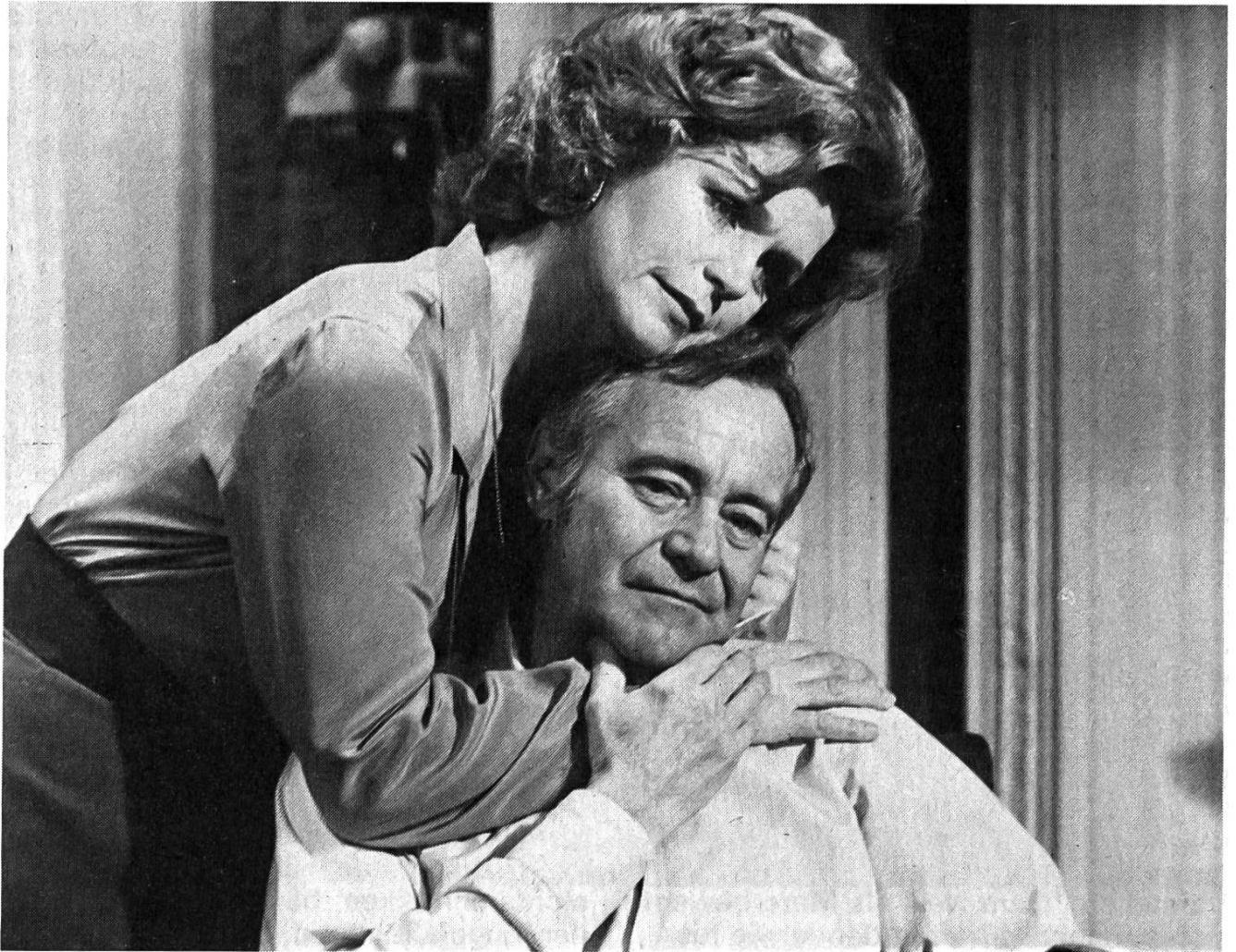
Entertainer in der Krise: Lee Remick und Jack Lemmon.

zeugen. Mit Maggies Unterstützung bringt er Jud dazu, den Sommer mit ihm in Manhattan zu verbringen. Weil aber Jud, ein ruhiger, ernster und in sich gekehrter junger Mann von 21 Jahren, das Gegenteil seines extravertierten Vaters ist, geht zunächst einiges schief. Scottie spielt auch seinem Sohn die Rolle des witzesprühenden Super-Quasslers und Sexbolzen vor und verschafft dem schüchternen Jungen auch gleich eine Freundin, indem er Sally auf ihn ansetzt. Doch Jud entdeckt das Spiel, das mit ihm getrieben wird, und reagiert stocksauer. Und als er auch noch feststellen muss, dass seine Mutter, gerührt von Scotties tragischer Situation, aus Mitleid und wegen der Erinnerung an die vergangene Liebe mit ihm ins Bett geht, packt er seine Koffern und will verreisen. Um ihn zum Bleiben zu bewegen, erzählt die Mutter Jud die