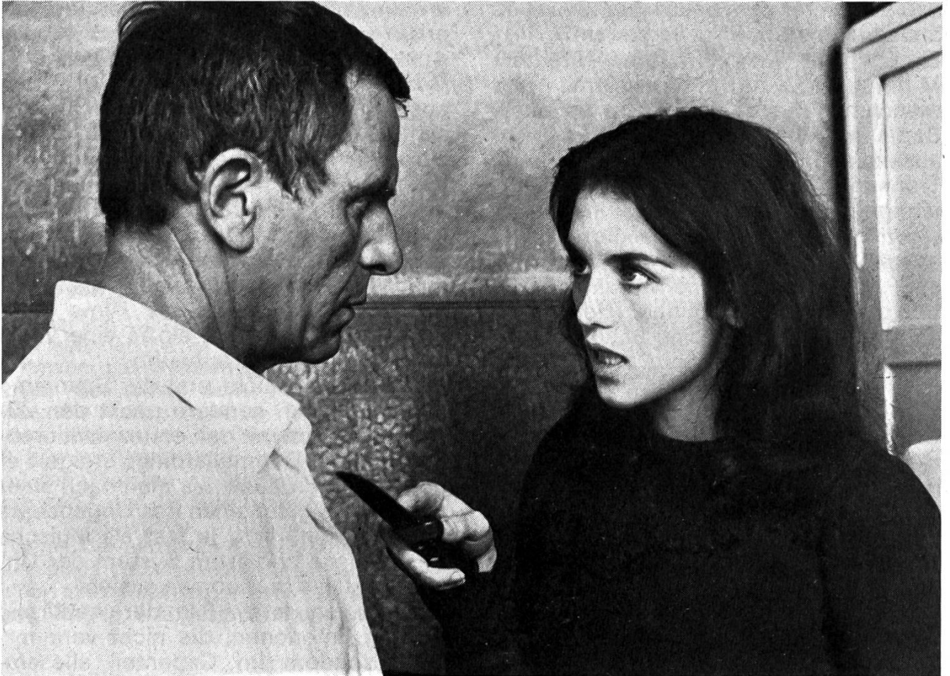
Isabelle Adjani und Heinz Bennent.

kommt im zweiten Teil auf, wo Zulawski die bis dahin nachvollziehbare Ebene des Psychodramas um die zerrüttete Zweierbeziehung verlässt und sie als Ausgangssituation erkennbar wird für einen tiefergehenden, aber auch recht ambitionen Diskurs über Gott – was Zulawski darunter auch verstehen mag. «Für mich ist Gott eine Krankheit», meint Marc zum Liebhaber seiner Frau, worauf der antwortet: «Weil er eine Krankheit ist, können wir zu ihm gelangen.» Anna ist krank, psychisch krank. Sie glaubt im Beruf und in der Familie versagt zu haben. Weil sie «nie gelernt (hat), 'ich' zu sagen», geht sie von Mann zu Mann, die für sie bestimmen und sie zwingen, «Rollen zu spielen», die nicht sie selbst sind. Eine Alternative zu diesem Dasein wäre der Wahnsinn, erwähnt sie einmal. Anna besitzt keinen Halt im Leben, keinen festen Glauben weder an sich selbst noch an Gott. Auf der Suche nach einer Bestimmung