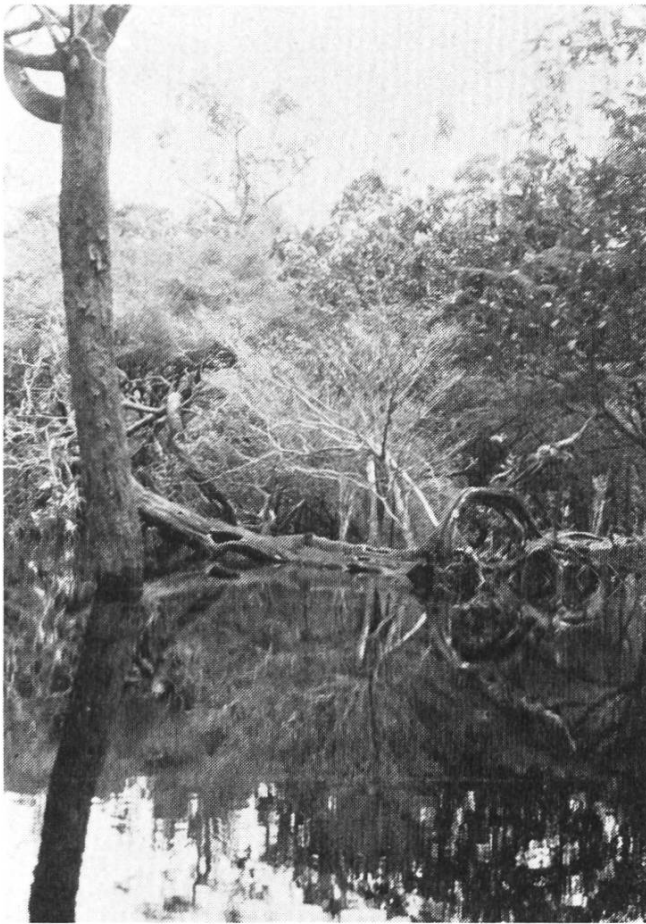
Mit der Zerstörung der Natur wird auch der Mensch bedroht.

Der zweite Teil des Features wendet sich dem vitalen brasilianischen Leben in den grösseren Städten zu. Die aus einer Vermischung von afrikanischen, europäischen und indianischen Eigenheiten entstandene Kultur wird durch eine Steigerung vorgeführt: Sie beginnt in den kleineren Ortschaften mit ihren echten zwischenmenschlichen Beziehungen. Musik und immer wieder Musik. Kneipen und öffentliche Plätze sind die Bühnen. Die letzte Station ist Rio. Touristen werden hörbar, Filmkameras surren; wir befinden uns wieder in einer Zivilisation, die uns bekannt ist. Nach Eindrücken von hektischen Strassen, von Armenvierteln und vom betörenden Nachtleben dieser Millionenstadt tritt am frühen Morgen, vor dem Sonnenaufgang, in unscheinbarer Ruhe die Natur nochmals an uns heran: Das Meer rauschen lässt die Reise ausklingen. Vielleicht ergibt sich beim Anhören von «Brasil» ein ähnlich faszinierendes Ge-