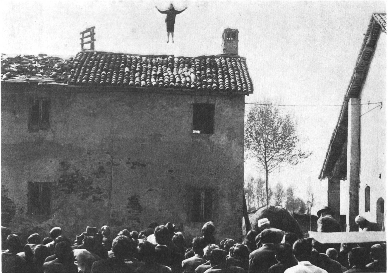
Einbrüche des Metaphysischen in Pasolinis «Teorema».

geben sie Anlass zu solchen Fragen, selbst dann, wenn es scheint, sie zeigen die Hölle. Auch wer das Bild einer unerlösten, vielleicht gar einer unerlösbaren Welt entwirft, fragt nach der religiösen Befindlichkeit des Menschen. Und eine negative Antwort heisst für die Kirche – oder sagen wir: für den Christen – doch keinesfalls, die Antwort hätte keine Bedeutung, weil sie aus christlicher Sicht «falsch» erscheinen mag.