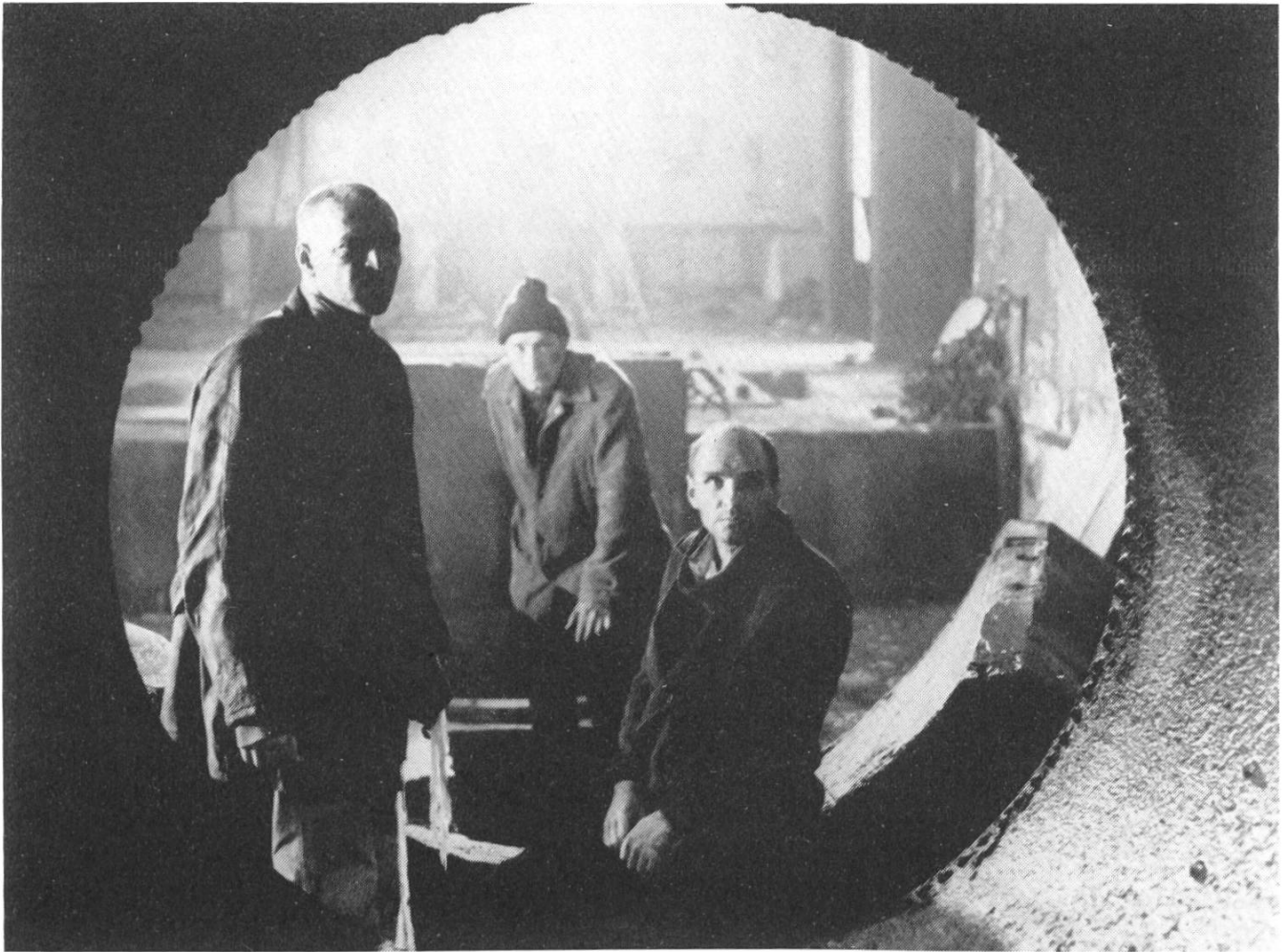
«Stalker» von Andrej Tarkowskij: Drei sind in die «Zone» eingedrungen.

schen Kapelle naiv-genial ins Bild gesetzt. Religiös ist, was diese meine Existenz vor allem in zwei Grunddimensionen berührt, die man in der Tradition als «Numinosum» und «Tremendum» bezeichnet hat: fasziniert und zugleich beängstigt sein von etwas, das meinem Zugriff entzogen ist. Es ist eine Art flüchtiger Durchblick, die Erfahrung der eigenen Relativität, aber auch der gleichzeitigen Verankerung in einem Seinsgrund, der zu tragen vermag. Eine solche religiöse Erfahrung ist zerbrechlich und anfechtbar. Was Sokrates von der Erfahrung der «Heimsuchung durch das Schöne» sagt, gilt auch hier: «Rede mit Vorsicht, sonst ist es schon weg».