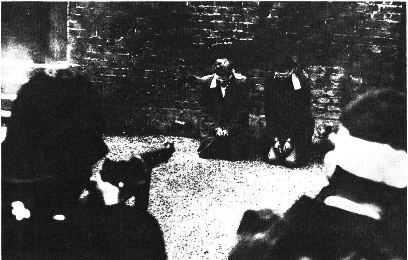
Antikriegsfilm, der die Wirkungen des Atomkriegs darzustellen suchte: «The War Game» von Peter Watkins.

arbeitet und zu pazifistischen Denkmälern verdichtet worden: «Iwanowo detstwo» (Iwans Kindheit, 1962) von Andrej Tarkowski, «Paths of Glory» (Wege zum Ruhm, 1957) von Stanley Kubrick, Roberto Rosselinis neo-realistische Trilogie «Roma, città aperta» (1945), «Paisà» (1946) und «Germania anno zero» (1947), Lewis Milestones «All Quiet on the Western Front» (Im Westen nichts Neues, 1930) und und... Auf der andern Seite blieben im Dritten Reich deutsche Spielfilme, welche in ihrer Handlung den aktuellen Weltkrieg thematisierten, eine Randerscheinung. Goebbels Propaganda im Spielfilmbereich beschränkte sich fast ausschliesslich auf Genres mit vorherrschend harmlosem Unterhaltungscharakter.