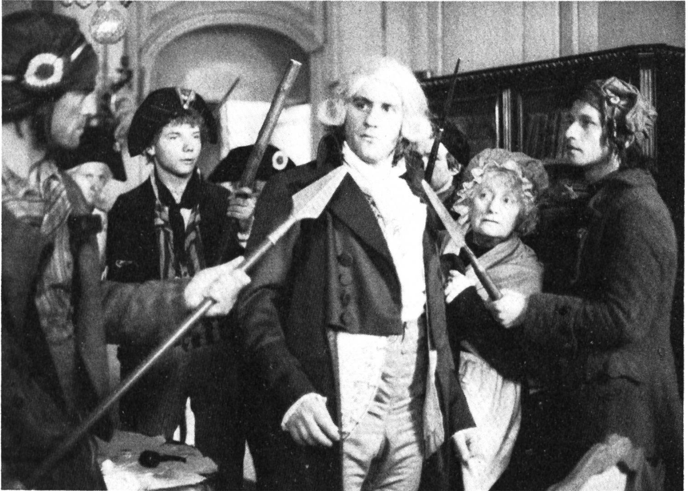
Gérard Depardieu als Danton.

einen Mann loszuwerden, beschuldigt man ihn sämtlicher Verbrechen. Diese Methode ist so alt wie die Welt, aber ich sehe, dass sie heutzutage noch verbessert worden ist... Die Gerechten haben noch immer die Politik gestört, heute mehr als je... Man muss mich töten, weil ich aufrichtig bin, weil ich die Wahrheit sage und weil ich Angst einflösse...» Auf den Einwand Robespierres «Wenn es ums Wohl der Republik geht, vergiss nicht, vergiss nie, dass wir alle Rechte haben», entgegnet Danton: «Ein Hoch auf die Mittelmässigen, Schweigsamen, Bitteren in der Einsamkeit ihrer Büros! Die Revolution ist wie Saturn, sie frisst sukzessive ihre eigenen Kinder. Warum wären wir denn verpflichtet, zu verurteilen statt zu vergeben, zu töten statt zu retten? ... Im Namen der Prinzipien der Revolution haben sie die Revolution selber vergessen! Sie haben eine neue Diktatur errichtet, noch schrecklicher als die alte.