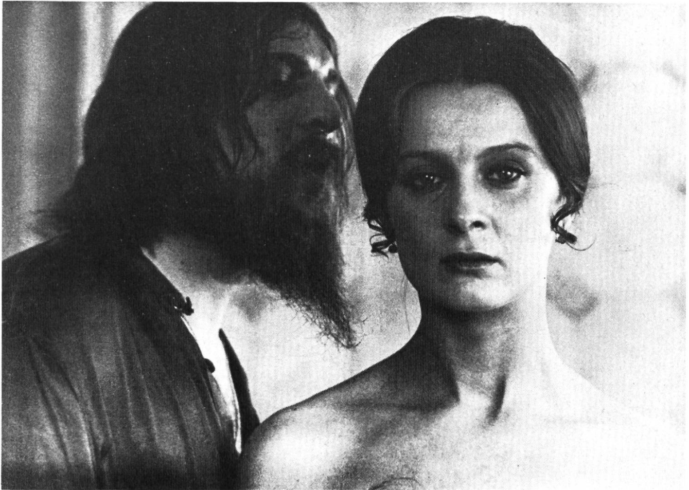
Rasputin (Alexej Petrenko) als Frauenbetörer.

beide an der Kamera stehen, sondern wo der eine weg ist und der andere an seinen Platz treten muss! So habe ich beschlossen, prinzipiell nichts zu ändern und ihre Lesart konsequent fortzusetzen, auszufüllen, so dass ich diese Arbeit nicht als meinen Film ausgeben möchte. Es ist voll und ganz ihrer!»