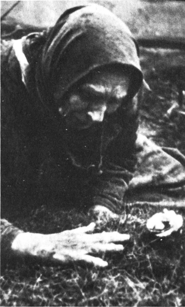
Eine Frau nimmt auf dem Friedhof von ihren Vorfahren Abschied (Foto direkt ab Leinwand).

schied von Matjora»: ein Motorboot, ein paar Männer, seltsam gekleidet, mit Kapuzen über den Köpfen; düsteres, diffuses Licht, wie auf Fotos aus der Zeit der Jahrhundertwende. Die Männer legen an, laden wortlos Werkzeug und mehrere Kanister aus. Schnitt ins warme Licht einer Wohnstube, alte Frauen sitzen um den Samowar, palavern und singen. Plötzlich Geschrei und Aufregung, draussen beim Friedhof ist etwas passiert, einer der einheimischen Männer ist verletzt worden. Im kleinen Inseldorf Matjora, irgendwo in Sibirien, in einem riesigen Fluss gelegen, ist der Teufel los. Das Niveau des Wasserspiegels soll zur Energiegewinnung angehoben werden. Das Dorf soll ausgelöscht werden, es soll von