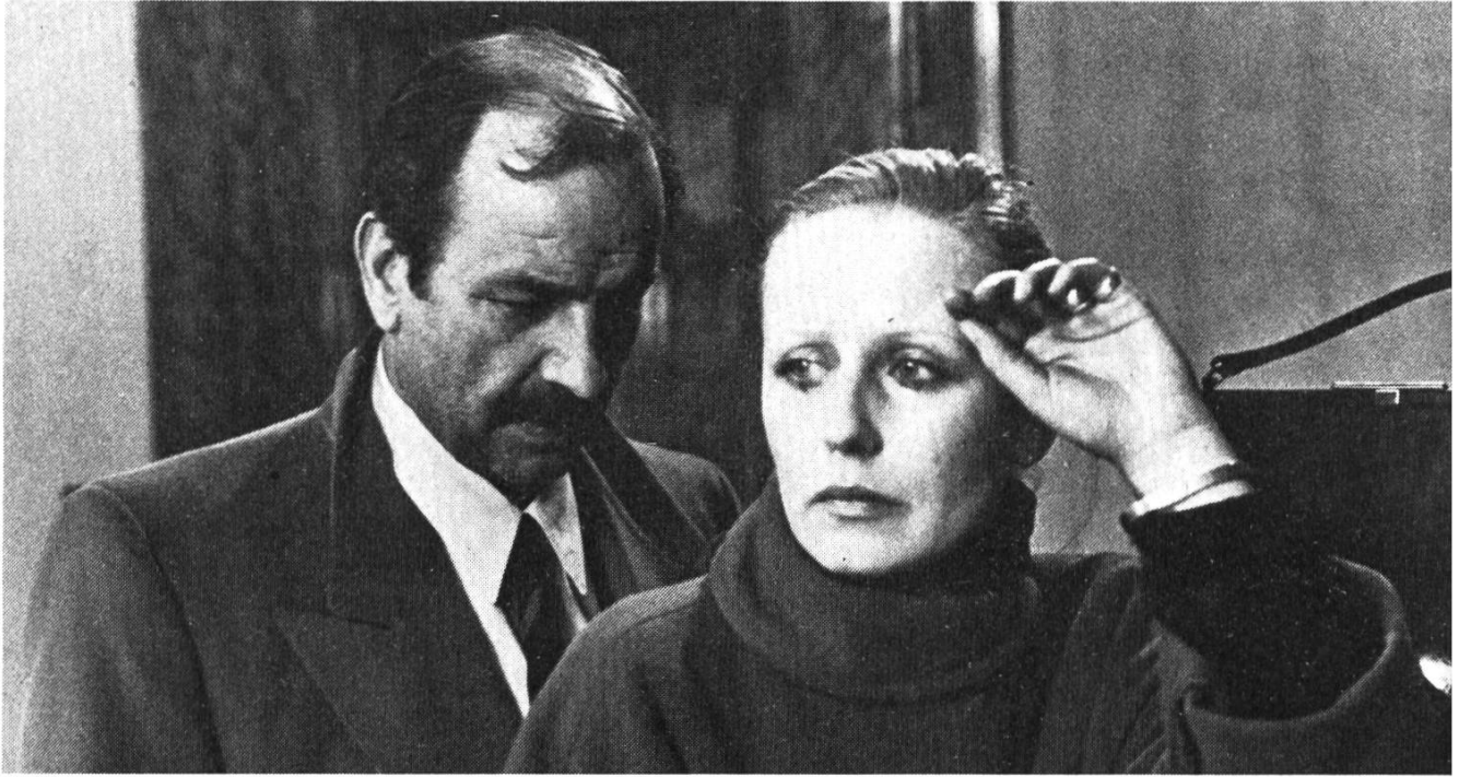
Armin Müller-Stahl und Krystyna Janda.

ten angreift. Und in den Träumen erscheint dem Knaben ein Adler, der sich einem Racheengel gleich auf jene stürzt, die ihn mit ihrem Verhalten verletzen, indem sie ihre Zuneigung andern schenken. Andres zieht sich, anders gesagt, in sich selber zurück; ein Zustand, dem er nur zu entrinnen vermag, wenn er sich mit seinem Grossvater unterhält, der allein ihm Liebe und Geborgenheit schenkt, ihn versteht und an seinen Geheimnissen teilhat, wie er ihn auch an den eigenen teilhaben lässt.