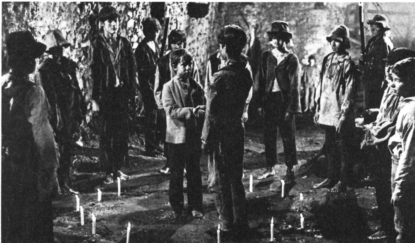
Vorabend-Serie «Die schwarzen Brüder».

ben die medienpolitischen Entwicklungen. Das Monopol der SRG zerbröckelt. Die Vorstellungen von der gesamtgesellschaftlichen Verpflichtung der elektronischen Medien scheinen ihre Berechtigung ebenso zu verlieren wie das Monopol, das sie einst begründet hatten. In der SRG, die nach offizieller Lesart eine quasi öffentlich-rechtliche Anstalt ist, greift ein quasi kommerzielles Denken immer mehr um sich. Die SRG wird seit einiger Zeit mit kraftmeierischen Sowohl-als-auch-Parolen regiert, die nachhaltig zur programmpolitischen Verwirrung beigetragen haben. Die Angst, durch jetzige oder künftige Konkurrenz aus dem Rennen um die Publikumsgunst geworfen zu werden, ist gewiss nicht ohne Grund. Umso dringender stellt sich die Frage, wie die gesamtgesellschaftliche Verpflichtung des öffentlichen Fernsehens in der neuen Mediensituation zu verstehen und in programmpolitische Leitsätze umzumünzen sei.