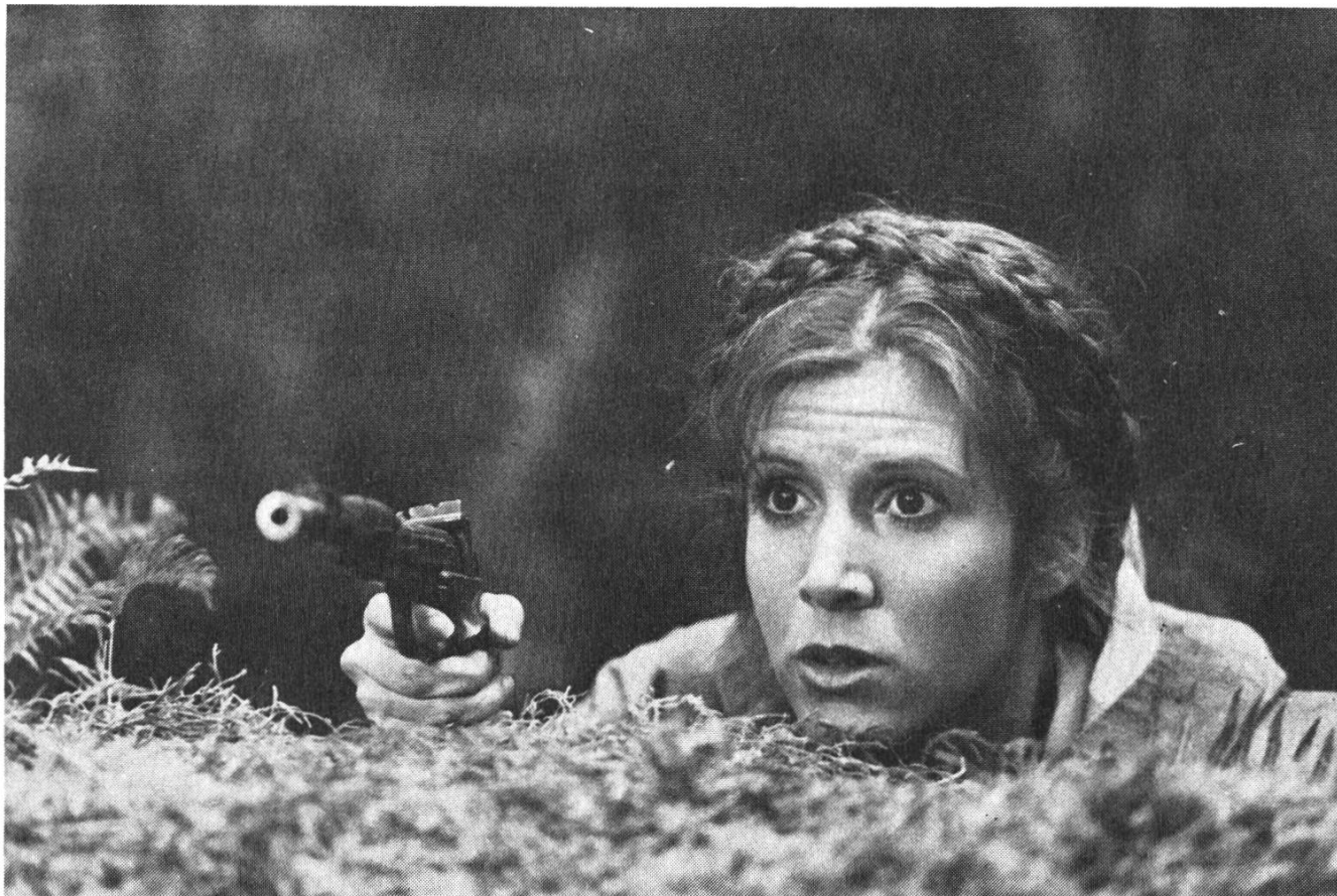
Carrie Fisher als Leia.

Dabei wies bereits «The Empire Strikes Back» diese Erzählstruktur mit ihren «Cliffhanger»-Situationen auf.