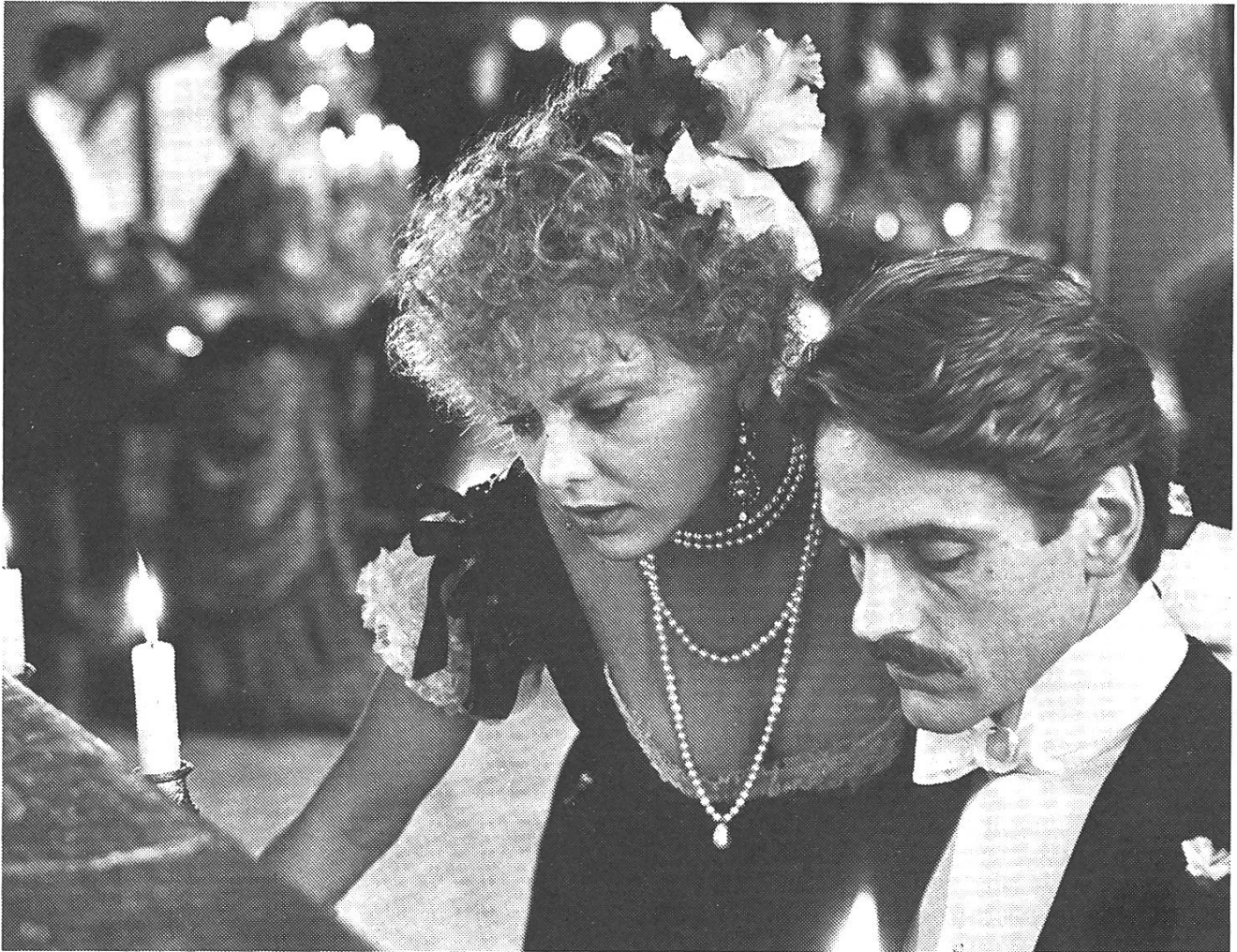
Ornella Muti und Jeremy Irons in «Un amour de Swann» von Volker Schlöndorff.

servieren, so wie Marcel Proust sein Werk geschrieben hat, um die Zeit heraufzuholen, zu fixieren und festzuhalten, als einzige Möglichkeit, sich selber unsterblich zu machen.