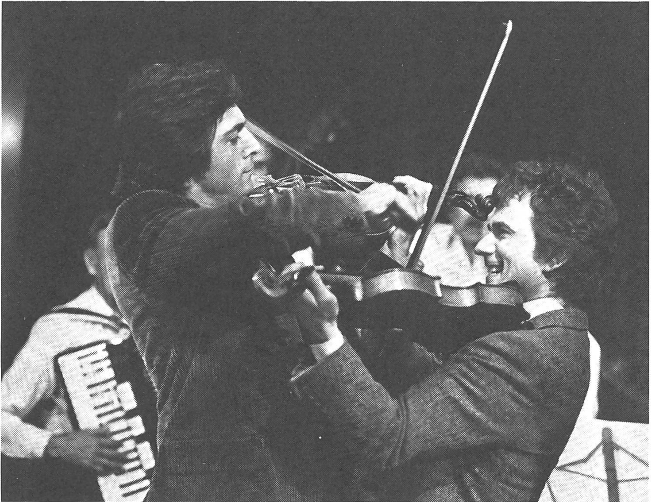
Armand Assante (links) und Dudley Moore in Violinen-Duell in «Unfaithfully Yours» von Howard Zeiff.

ker versucht zu entlarven, was gar nicht geschehen ist. Dass der eigentlich Betrogene sein Freund ist – dessen Frau sich in der Wohnung des Dirigentenpaares mit einem Liebhaber vergnügt hat – wird ihm erst ganz am Schluss bewusst. Dieses Missverständnis führt zu einer umwerfenden Dialogpassage, in der Moore und die Kinski heftig um den Brei herumreden und nicht merken, dass jeder etwas anderes meint: Er wirft ihr vor, ihn betrogen zu haben, während sie sich dafür rechtfertigt, dass sie die gemeinsame Wohnung einem anderen Liebespaar zur Verfügung gestellt hat.