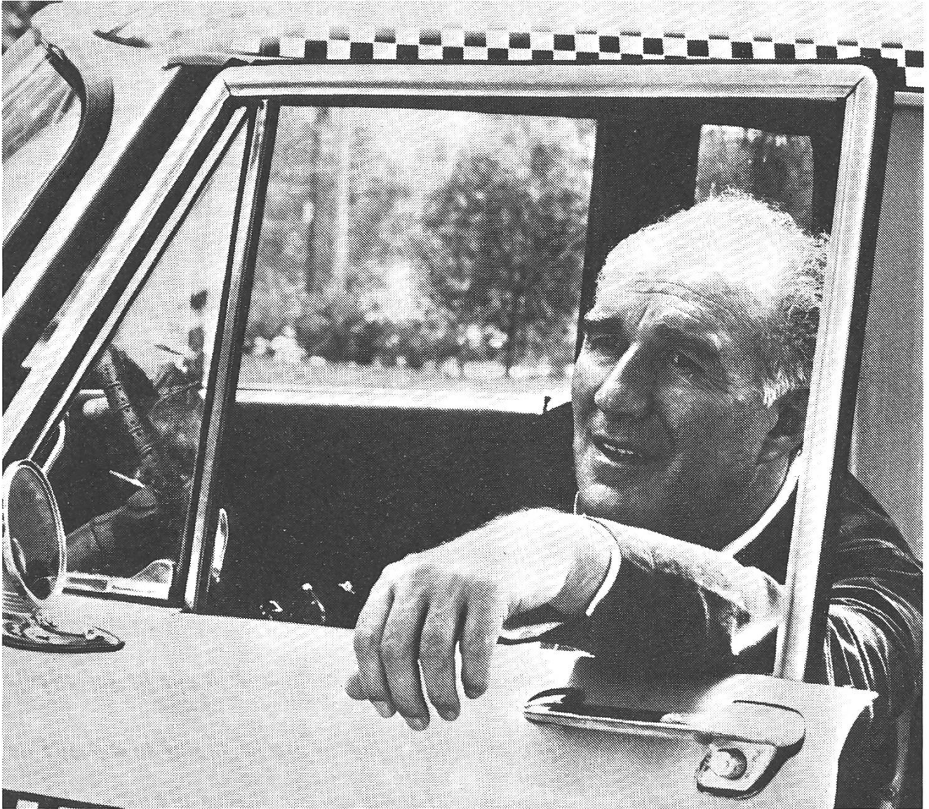
Unangenehm neugierig: Michel Piccoli als Schweizer Reporter René Winterhalter.