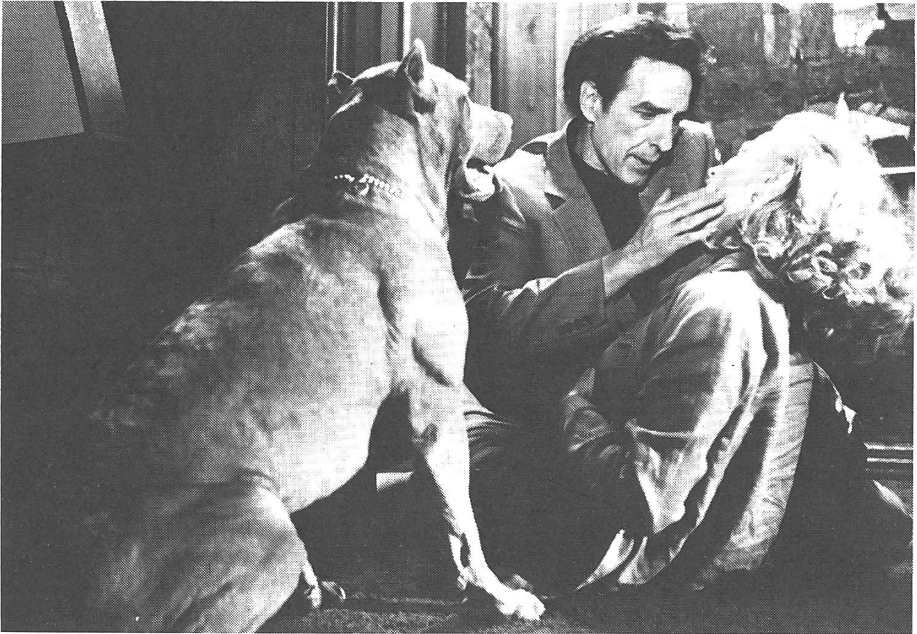
Gena Rowlands und John Cassavetes in «Love Streams».