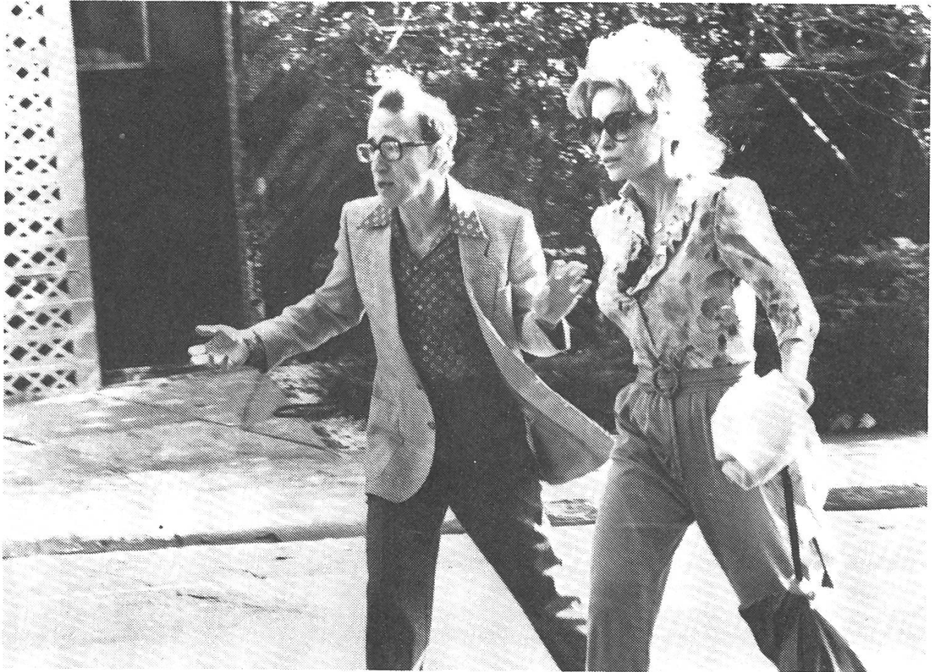
Danny Rose (Woody Allen) und Tina Vitale (Mia Farrow) retten sich vor der Mafia.

gekannt haben –, sitzen und trinken, schwatzen und lachen, erzählen sich Anekdoten, Witze, Geschichten, tauschen Erinnerungen aus an die Zeiten, als New Yorks unzählige billige Nachtlokale bevölkert waren mit ebenso unzähligen billigen Varieté-Künstlern und ihren nimmermüden Vermittlern, die selbst den verrücktesten «act» noch irgendwo an den Mann brachten.