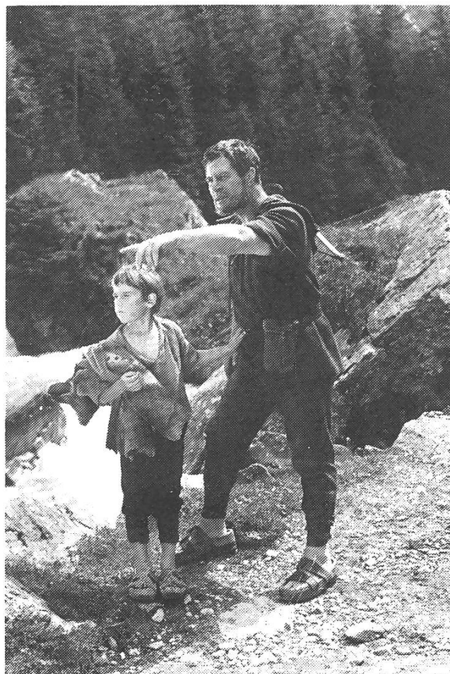
Michael Dickoffs «Wilhelm Tell» kommt nicht über folkloristische Historienmalerei hinaus.

Tell» über weite Strecken des Codes durchschnittlicher Hollywood-Filme: Die Szenerie schweizerischer Gebirgslandschaft erstrahlt in den schönsten Farben, es wird auf Dramatik und Sentimentalität geachtet, und auch die bunten Phantasielkostüme sind ganz auf ein möglichst breites – wenn möglich internationales – Publikum zugeschnitten. In dieser Beziehung ist «Wilhelm Tell» mit den Gotthelf-Filmen aus jener Zeit zu vergleichen, in denen die Darstellung politischer und sozialer Hintergründe einer folkloristisch-kolportageartigen Ambiance zu weichen hat, wo sich das Emmental gleichsam in den Wilden Westen verwandelt. Dennoch war auch Dickoffs Film – gerade während der Zeit des Kalten Krieges – darauf ausgerichtet, demonstrativ auf die mythischen Ursprünge freiheitlich-eidgenössischen Kulturgutes hinzuweisen. Dass der Film gerade in der Sowjetunion mehr Anklang fand als in der Schweiz