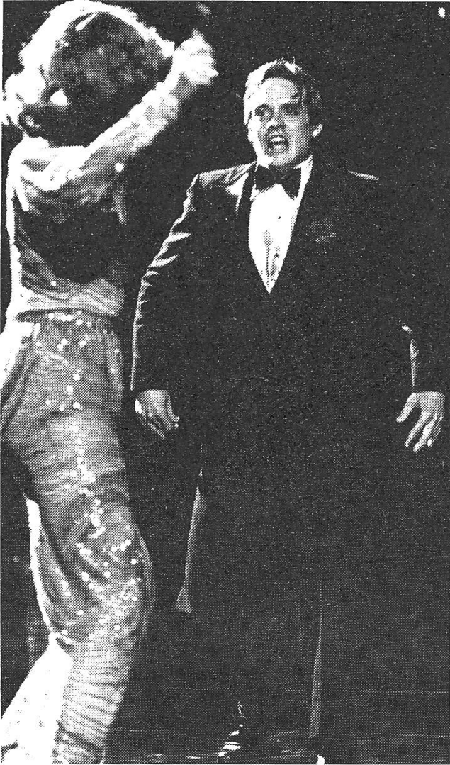
Der Mörder und sein Opfer.

auch, die sie verunsichert, weil sie als Person ebenfalls verunsichert ist. Ihre Ehe wurde geschieden, ihr Ex-Mann, ein vielbeschäftigter Filmproduzent, weilt gerade wieder einmal in New York und besucht Sally. Zusammen konnten sie nicht mehr leben, aber auch getrennt halten sie es nicht so ganz aus. Sally vermisst ihren Ex-Mann, liebt ihn noch immer, ohne ihn hat sie nur noch die Bühne und ihre Fans, doch diese kommunizieren nur mit ihrer Sekretärin und geben sich in der Regel auch damit zufrieden, die neuesten Fotos ihres Lieblinges zugeschickt zu bekommen.