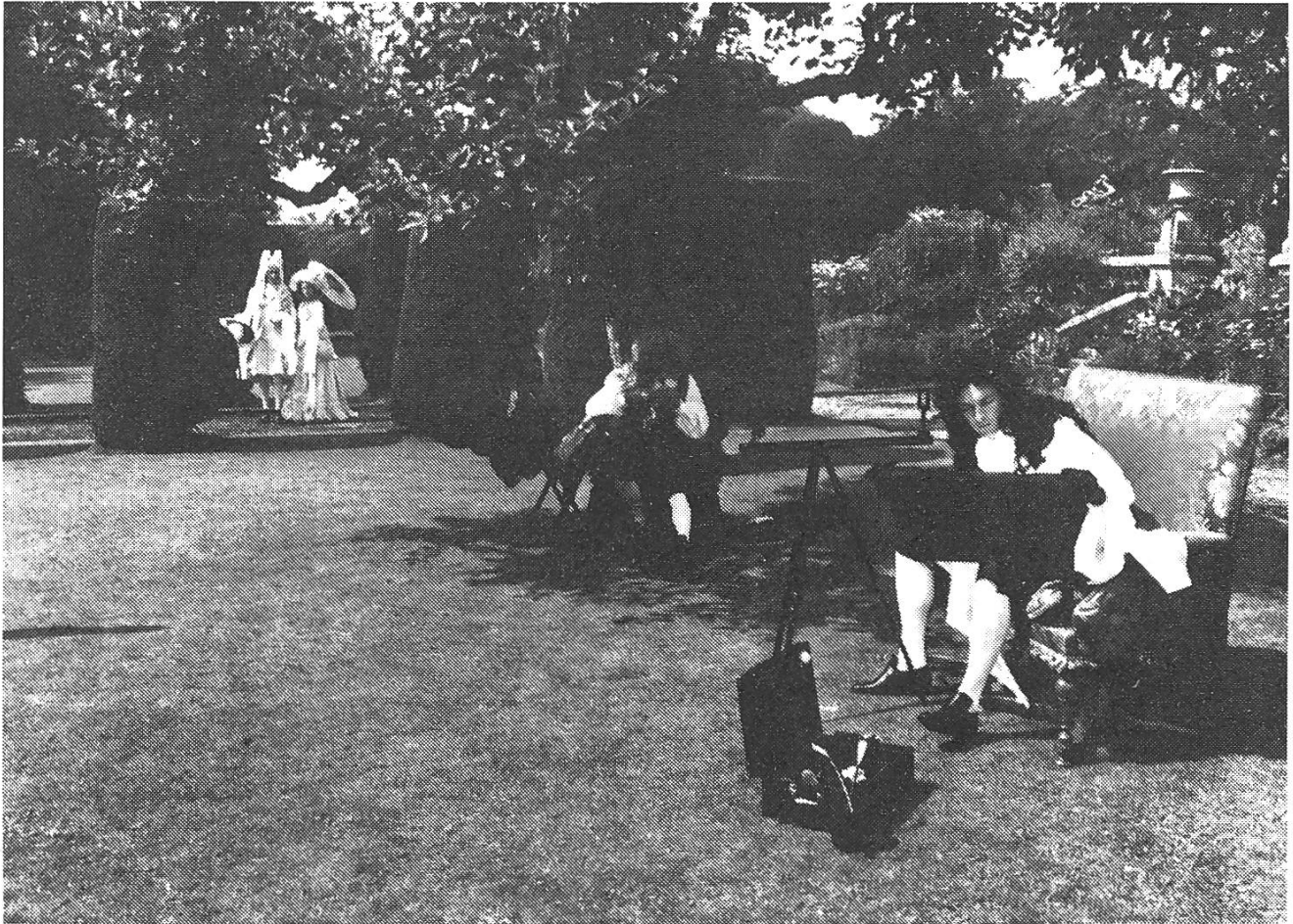
Mord im englischen Garten.

Revolution – politisch an Einfluss verloren. Eine neue Klasse etabliert sich im Staat: die Gentry, der Landadel. Mit der politischen Macht entfalten diese Aufsteiger ihr kulturelles Plagiat nach den Vorstellungen des dekadenten Hofes. Man imitiert die Fashions vom Kontinent, hofiert, intrigiert und antichambriert wie schon am Hofe Heinrichs VIII. einige Generationen früher – ohne die Lebensfreude der Renaissance freilich. Das Vergnügen wird verbissen konsumiert, hohle Phrasen bestimmen das Denken. Es herrscht ein Milieu der Macht des Materiellen, in dem Greenaway seine Handlung als pompöse Karikatur des lebenswidrigen Restaurationsdramas spielen lässt, wo Lust und Liebe, Kunst und Können in Pfund entgolten werden – und entsprechend zu beziehen sind.