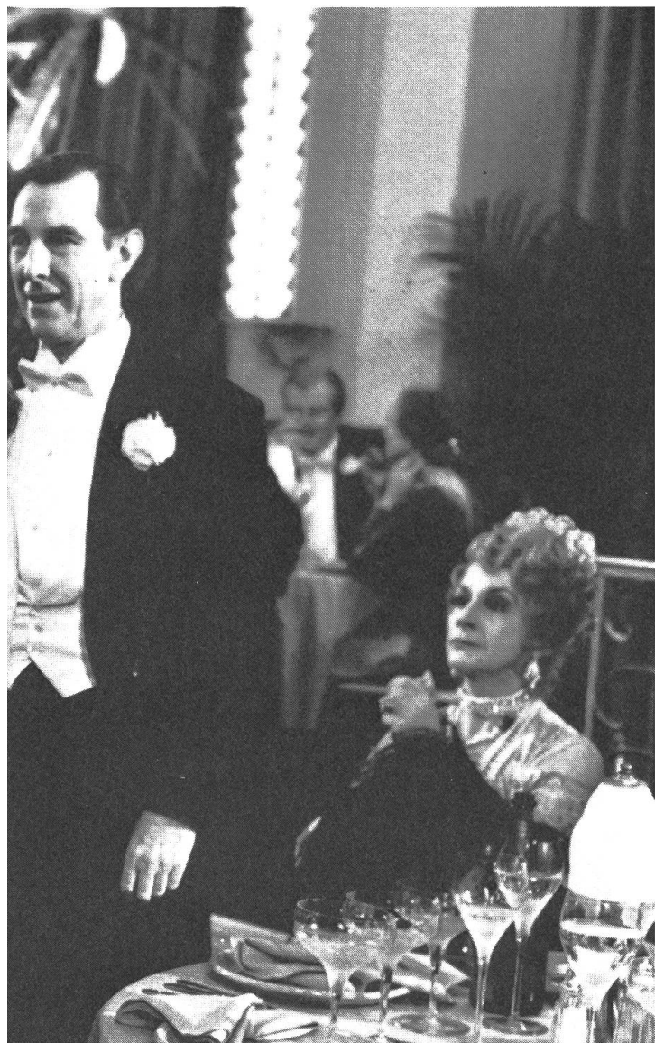
Wenn die Helden von der und die «Realen» auf die Leinwand steigen: «The Purple Rose of Cairo» von Woody Allen.

am Filmfestival von Cannes ist augenfällig. Sie wird nicht nur sichtbar auf den Strassen, wo die Plakate, Affichen und Leuchtreklamen vorwiegend für US-Produktionen werben, sie schlägt sich auch in dieser Berichterstattung nieder. Da ist vorwiegend von amerikanischen Filmen die Rede. Nun hat das, sieht man einmal von einem Werk wie «The Purple Rose of Cairo» ab, keineswegs damit zu tun, dass sich das amerikanische Filmschaffen auf einsamer künstlerischer Höhe bewegt, sondern doch eher mit der Tatsache, dass sich das Filmschaffen in vielen europäischen Ländern in einer Talsohle befindet. Überdies ist Cannes, besonders was die offizielle Auswahl be-