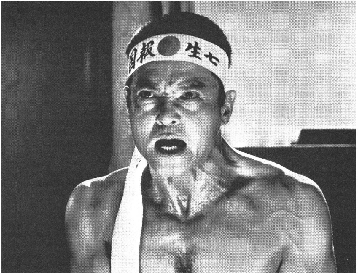
Ken Ogata als Schriftsteller in «Mishima» von Paul Schrader.

über die darin beschriebene menschliche Tragödie hinaus zu einem recht anschaulichen Sittenbild des 19. Jahrhunderts geworden, zu einer kritischen Auseinandersetzung auch mit der Unterdrückung des Menschen durch den Geist des Puritanismus.