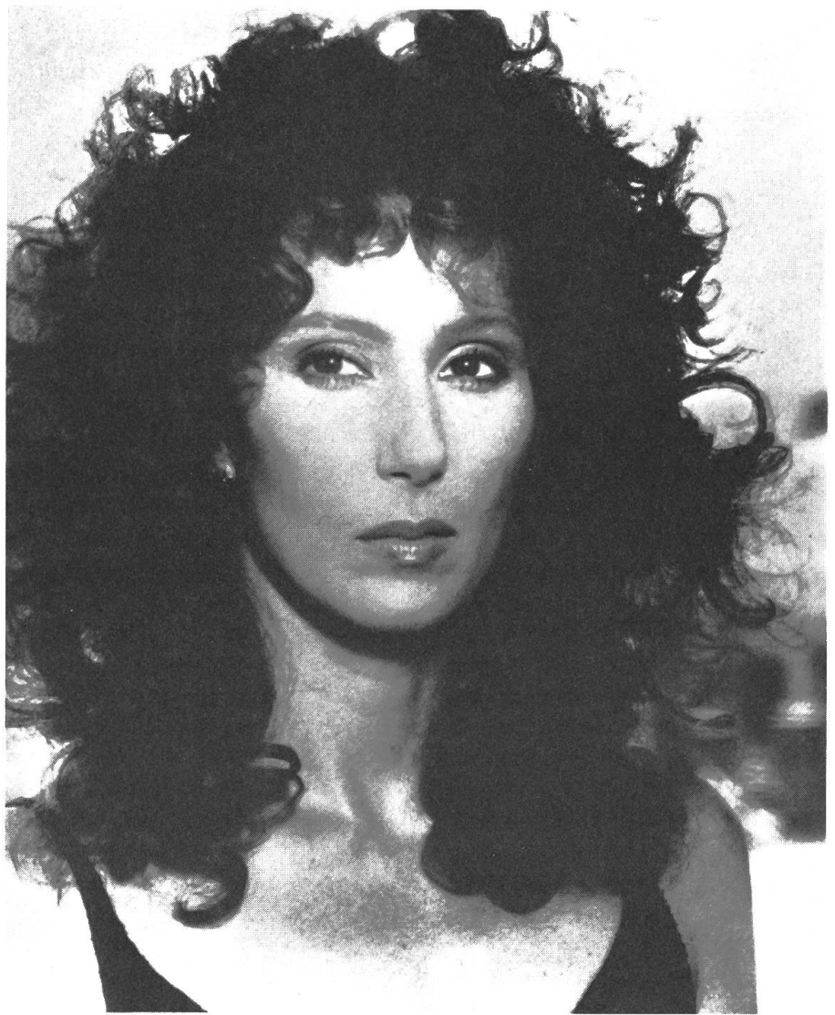
Mit Norma Aleandro teilt Cher für ihr eindrückliches Spiel in «Mask» die Palme für die beste Darstellerin.