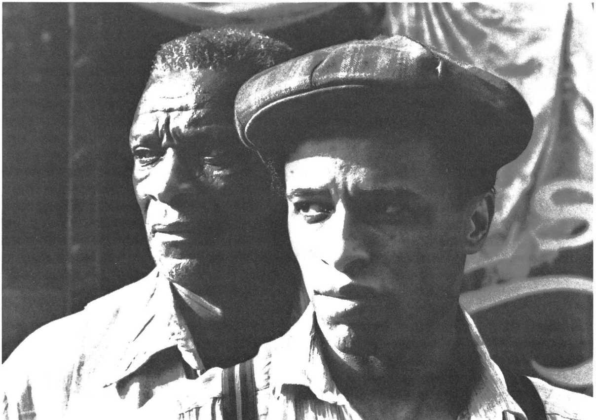
Unten: Moses Gunn und Damien Leake in «The Killing Floor» von Bill Duke.